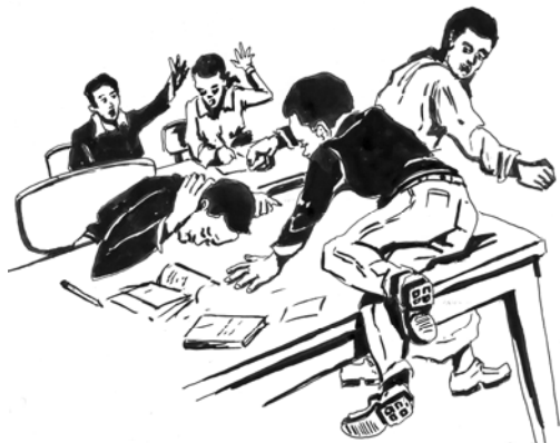
ሥዕል 9.2 የክፍል ውስጥ መገልገያ መሣሪያዎችን በአገባቡ አስመጠቀም ቁጠባን ይፃረራል