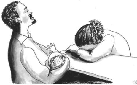
ሥዕል 9.4 ልጅን በምን ሳሳክም?