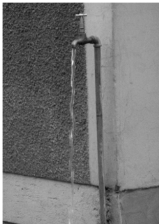
ሥዕል 9.1 ቁጠባን አስማወቅ