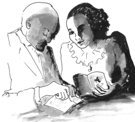
ሥዕል 9.5 በቀጠብነው ገንዘብ ምን እንገዛ?