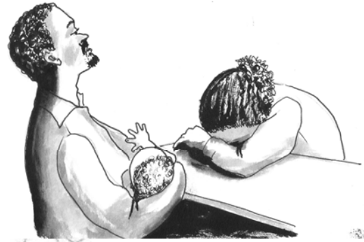
Fakkii 9.3. Mucaa ko maaliin yaalchisaa?