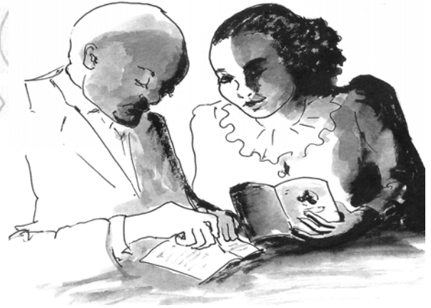
Fakkii 9.4. Maallaqa qusannen maal haa binnu?