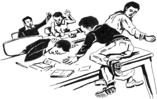
Fakkii 9.1. Qabeenyatti haala malee fayyadamuun qusannaa faallessa