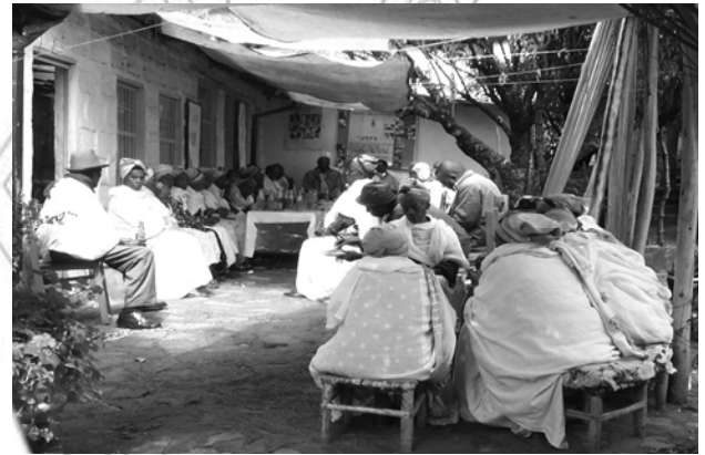
Fakkii 9.5 Afeerraa humnaa olii qusannaa miidha