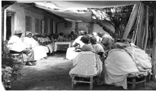
ስእሊ 9.6 ልዕሊ ዓቕሚ ድግስ ባህሊ ምዕቋር ይጎድእ።

እቲ ምድላው ምስተወደአ ኣብ ወርሒ ሓምለ ሓያል ድግስ ወደም ካብ ኦዲስ አበባ መልሲ ፀውዑ። እቲ ዝኾርዕሉ ወደም እንተደልዩ 50 ዝኣኸሉ ኣጋይሽ ሒዙ ንኸመፅእ ኣተሓሳስብዎ። ንእኡም ድማ ብዙሕ ዓመታት ኣብ ዝነበረሉ ከባቢ ሕማቕን ፅቡቕን ሓቢሮምዎም ዘሕለፉ ሰባት ዓዲሞም እቲ ድግስ ተኻየደ። ዳዊት ብተግባር ኣቡኡ ስግኣት ሓደሮ። ብመጠኑ ብዙሕ ሃፍቲ ከየጥፍኡን ኣብ ዕዳ ከይኣተዉን ምድጋስ ከምዝግበኦም ዋላኳ እንተነገሮም ሓደ ግዘ ዝወሰንዎን ካብናቲ ክብሪ ንላዕሊ ዝምነይዎ ነገር ከምዘየለን ብምንጋር መለሱሉ።