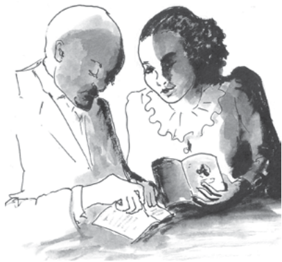
ስእሊ 9.5 ብዝዓቕርናዮ ገንዘብ እንታይ ንግዛእ?