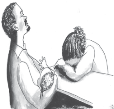
ስእሊ 9.4 ወደይ ብምንታይ ክሓክሞ?