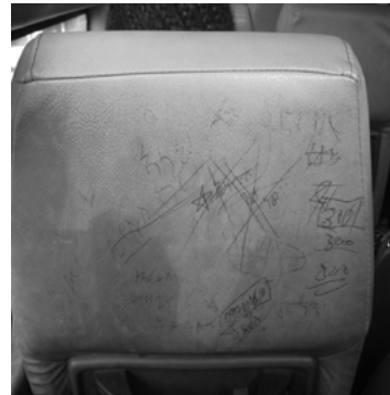
ስእሊ 9.2 ኣብመገልገል ናውቲ ዝተፈላለዩ ዕሑፋት