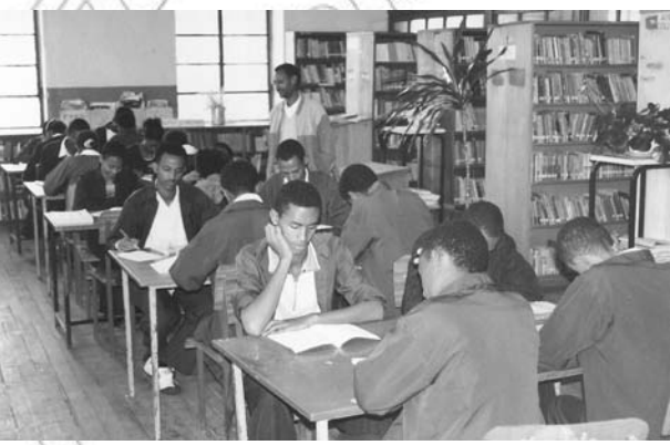
ሥዕል 11.5 መጽሐፍን በማንበብ ሳይንስዎ አስተሳሰብን ማዳበር