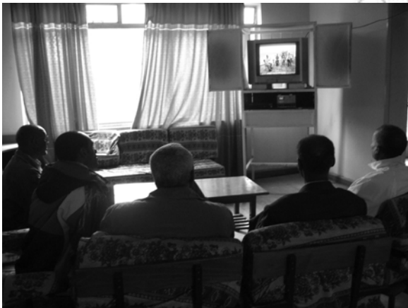
ሥዕል 11.4 የተሰያዩ የመረጃ ምንጮች