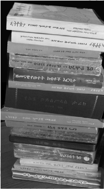
ሥዕል 11.6 የዕውቀት ምንጭ ከሆኑት ውስጥ መጽሐፍት አንዱ ናቸው