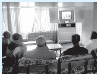
Jaantuska 11.2 Farsamooyinka iyo illaha lagu helo xogaha (Wararka)