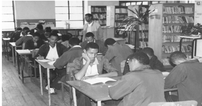
ስእሊ 11.7 መፅሓፍ ኣንቢብካ ሳይንሳዊ ኣተሓሳስባ ምዕባይ