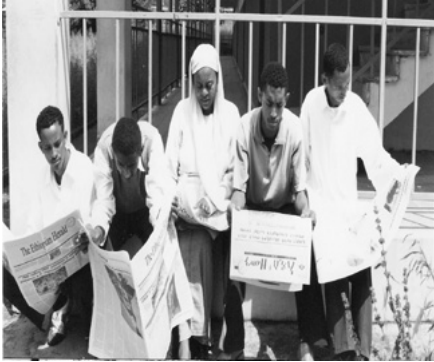
ሰእሊ 11.4 ሰባት ጋዜጣ እንተ-ንብቡ