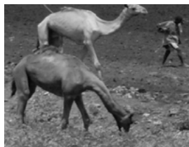
ስእሊ 11.2 ግመል