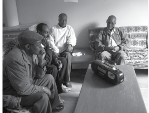
ሰእሊ 11.5 ሰባት ፊደሎ እንተ-ዳምፁ