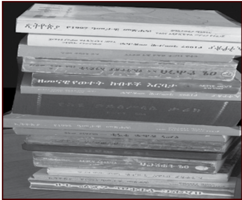
ስእሊ.11.8 ካብ መንጎ ፍልፍላት ፍልጠት መፃሕፍቲ ይርከብዎ።