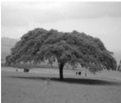
ስእሊ 11.1 ኦም