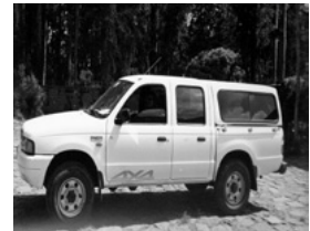
ስእሊ 11.3 መኪና