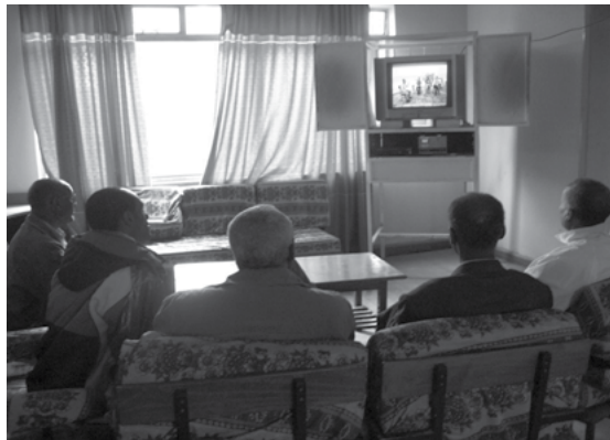
ሰእሊ 11.6 ቴሌቪዥን እንተ-ርእዩ