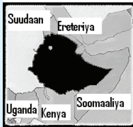
Jaantuska 1.9 Itoobiya iyo dalalka jaarkeeda