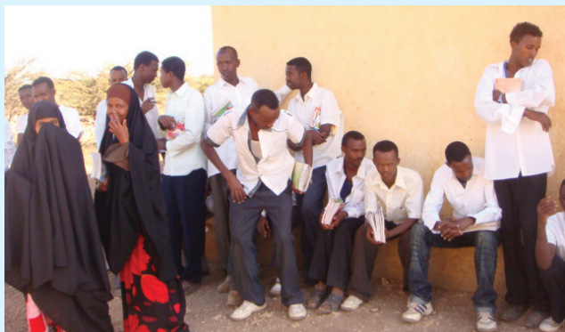
Jaantuska 1.4 wakhtiga biririfta ardayda