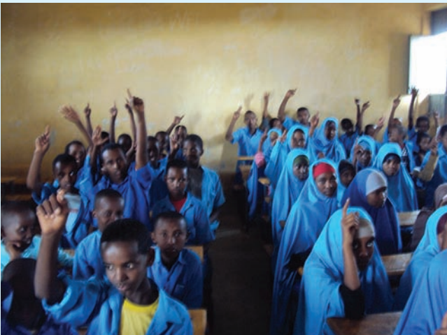
Jaantuska 1.1 Doorashada horjoogaha fasalka