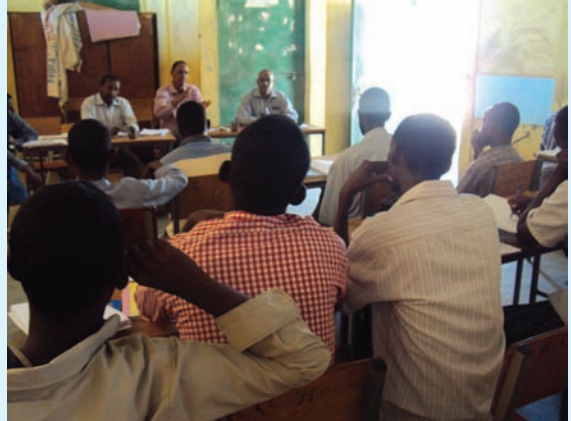
Jaantuska 1.2 Nidaamka sharciga iskuulka

Waxaa badanaa maqashaan erayga dimuqraadiyada balse inta aynaan gudo galin macnaha dimuqraadiyada waxaad akhridaan sheekadan soosocota oo xambaarsan ama ku tusaysa macnaha dimuqraadiyada, intaydaanse sheekada akhrinin barahiina u sheega waxaad ka taqaanaan macnaha dimuqraadiyadda iyo waxaad ka maqasheen.