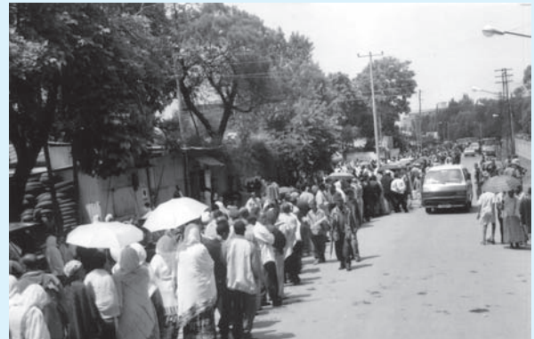
Jaantuska 1.5 Dad doorasho saf ugu jira