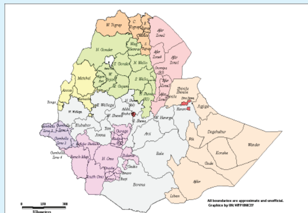
Jaantuska 1.7 khariirada itoobiya