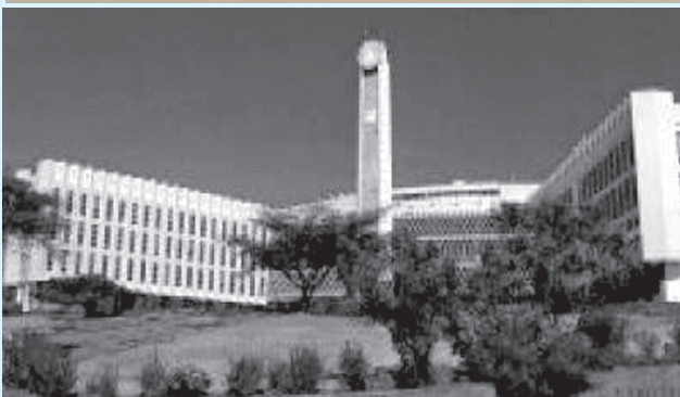
Jaantuska 1.8 Ismaamulka magaalada Jijjiga iyo Ismaamulka magaalada adhis ababa