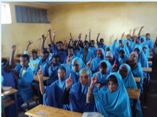
Jaantuska 1.3 samaynta kooxaha iskuulka