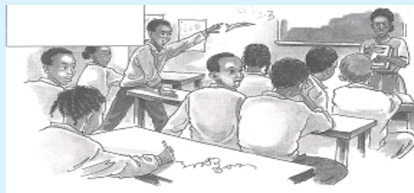
Jaantuska 2.4 fasal aan lagu dhaqmayn nidaamka iyo sharciga