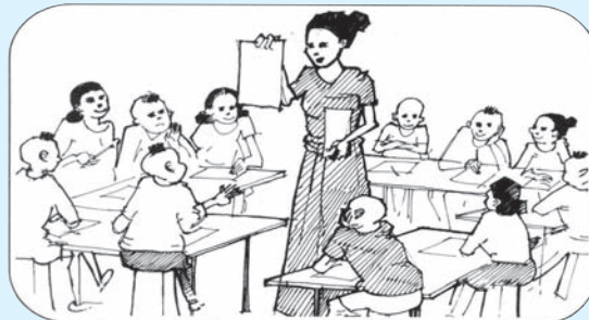
Jaantuska 2.3 fasal lagu dhaqmayo nidaamka iyo sharciga