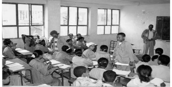
Fakkii 3.4. Barattoonni daree keessatti