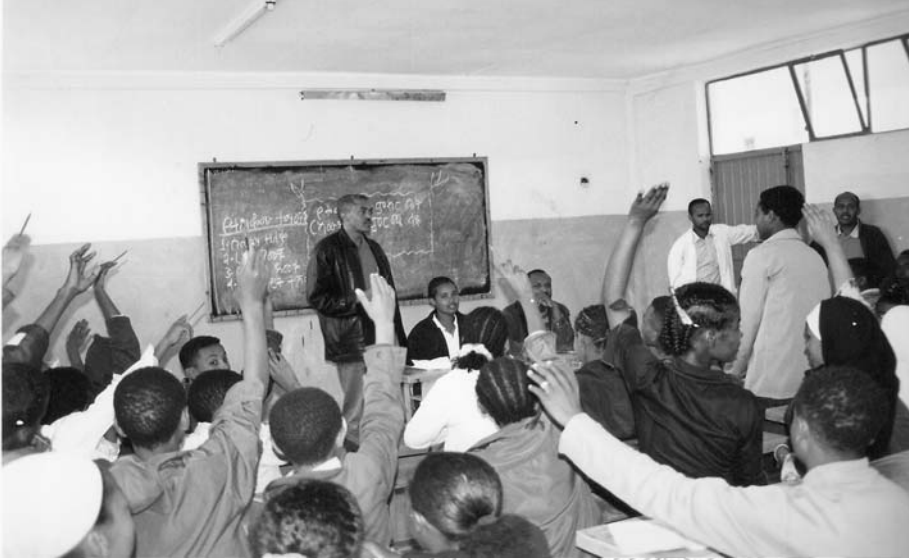
Fakkii 3.2. Barattoonni adeemsa filannoo irraatti.

barattootaa ta'uuf kaadhimamaa ta'ee dhihaatee dorgomuu ni danda'a." Jedhe. Qajeelfama haara`a fooyya'ee ba'e kanarratti hundaa'uun miseensota shan kan qabu manni marii barattootaa mana barumsichaa hundeeffame.