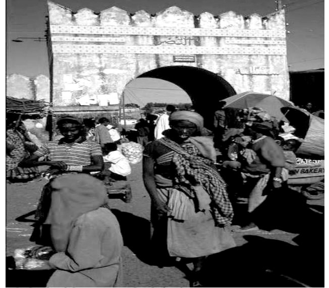
Fakkii 3.5 Aadaa adda addaa agarsiisu.