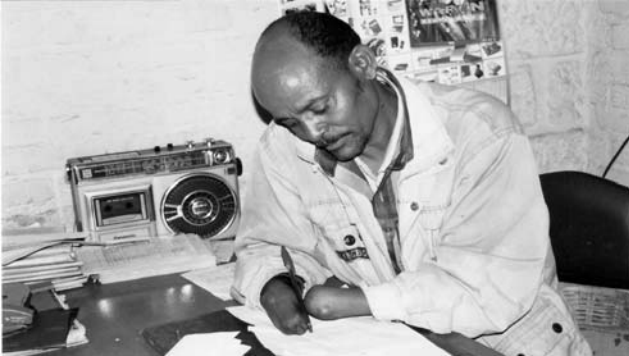
Fakkii 3.6 Qaama miidhamtooti akkuma lammii kamiyyuu omishuu ni danda’u

Qaama miidhamtoonni akkuma nama kamiyyuu kabaja guutuu qabu.