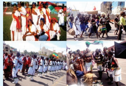
Jaantuska 3.5 Dhaqano kala duwan