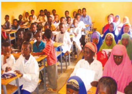
Jantuska 3.4 ardayda oo fasalaka ku jirta