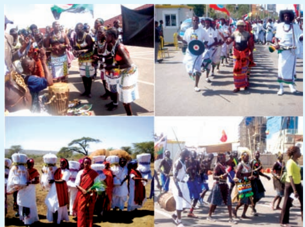
Jantuuska 3.1 quruumo, qowmiyado iyo shucuubta wadan