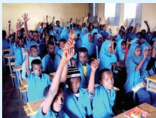
Jantuska 3.2 ardayda oo doorasho ku jirta

Iskuulka dhexdiisa oo ay jirto nidaam shaqo oo aan jinsiga, midabka, diinta iyo xaalada hal kale la gaadhsiinayn xaqdaro ayaa tilmaamaysa tixgalinta xuquuqda sinaanta. Xuquuqaha loo baahan yahay in la tixgaliyo iskuulka dhexdiisa waxaa ka mida. Arday kasta su'aasha uu fahmi inuu waydiiyo, ka jawaab su'aasha la waydiiyay, ka qaybgalo kooxaha kala duwan ee iskuulka, fikrad ka bixiyo arimaha iskuulka ee khuseeya, ilaalinta hantida iskuulka iyo wixii la mida weeyaan.