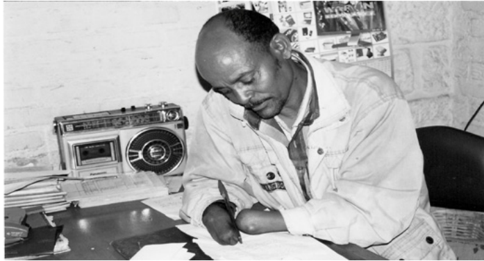
ሰጳሊ 3.6 ጉዳኣት ኣካል ከም ካልእ ሰብ መፍረይቲ ዜጋታት እዮም።