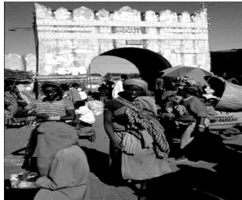
ስእሊ 3.5 ባህሊ ዝተፈላለዩ ህዝብታት

• ተምሃሮ ኣብ ላዕሊ ካብ ዝተግዘብኩምዎ ስእሊታት እንታይ ተረዲእኹም?