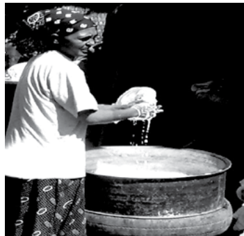
ሰእሊ 3.3 ኣደን ውላድን ኣብ ስራሕ ክለዉ.