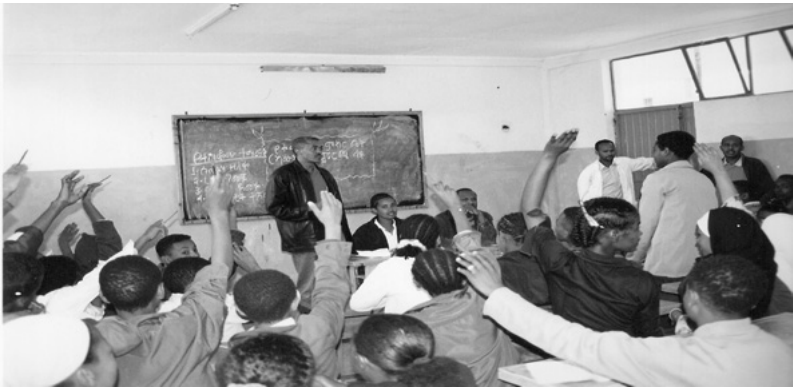
ስእሊ 3.2 ተምሃሮ ኣብ ከይዲ መረፃ ፓርላማ ተምሃሮ

ዝኾነ ተምሃራይ እዚ ቤት ትምህርቲ ንኣባልነት ፓርላማ ተምሃሮ ብሕፁይነት ምቕራብን ምውድዳርን ይኸእል። ብመሰረት ተመሓይሹ ዝቐረበ መምርሒ ድማ ሓመሽተ ኣባላት ዝሓዘ ፓርላማ ተምሃሮ እቲ ቤት ትምህርቲ ተመስረተ።