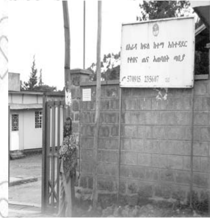
Fakii 4.9 Dhaabbilee Hawaasummaa