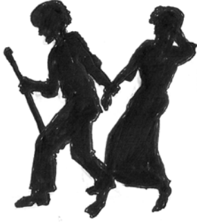
Fakkii 4.7. Butii