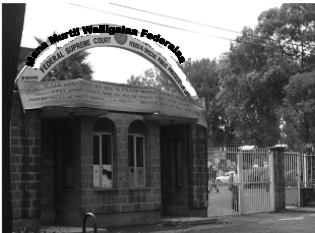
Fakkii 4.3 Mana Murtii Waliigala Federaalaa