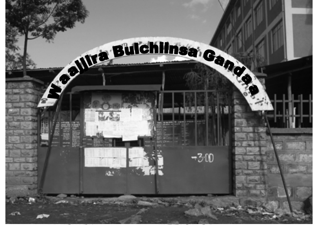
Fakkii 4.4 Waajjira Bul/ Gandaa