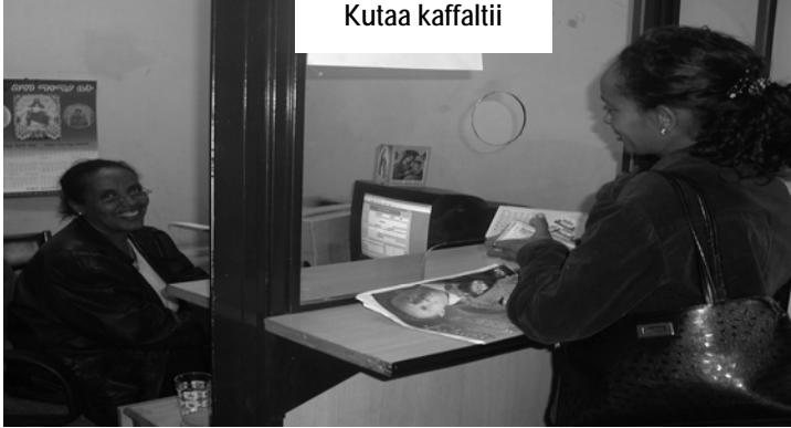
Fakkii 4.10 Haala kaffaltii gibiraa