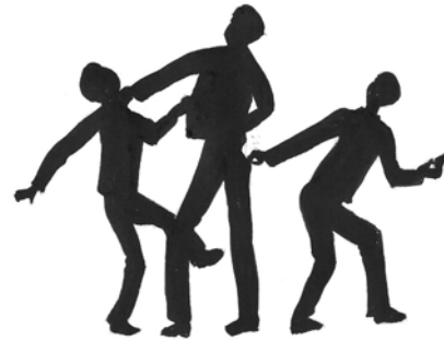
Fakkii 4.6. Lolaa fi hanna