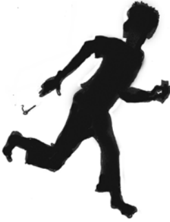
Fakkii 4.8. Qabeenyaa Baleessanii baqachuu