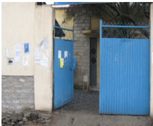
ስእሊ 4.4 ከባብያዊ ምምሕዳር ቀዳማይ ወያነ