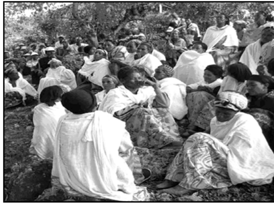
ስእሊ 4.2 አወሃህባ ባህላዊ ፍትሒ