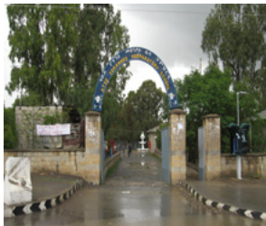
ስእሊ 4.3 ላዕላዊ ቤት ፍርዲ ክልል ትግራይ