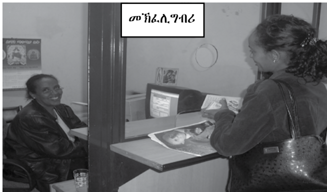
ሰእሊ 4.10 ሰርዓት ኣከፋፍላ ግብሪ