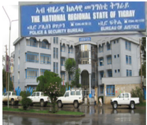
ስእሊ 4.5 ቢሮ ፖሊስ ፍትሕን ፀጥታን