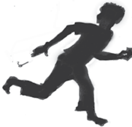
ስእሊ 4.7 -ንብረት ኣፅኒኻ ምህዳም