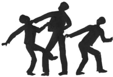
ስእሊ 4.6 ባእስን ስርቅን