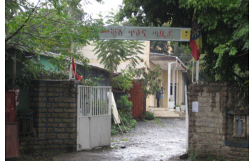
ሰእሊ 4.9 ትካላት ውሃብቲ ማሕበራዊ ግልጋሎት