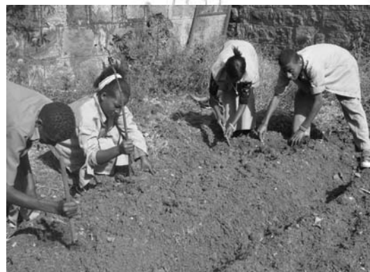
ሥዕል 5.2 ከሀገር ፍቅር መለማመጃ መደረጎች አንዱ