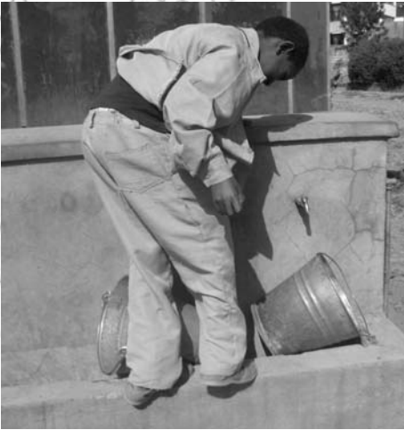
ሥዕል 5.3 ጉብረትን ማበላሸት የሀገር ፍቅር ካለው ዜጋ አይጠበቅም

በትምህርት ቤቱ ጓሮ የተተከለውን የአትክልት ማሣ የአካባቢው ከብቶች ጉብተው ሲያበላሹት አያገባኝም ብሎ ከፍተኛ ጥፋት እንዲደርስ ምክንያት ሆኗል። የአብራር “ቀስቶ” ባህርይ ከዕለት ዕለት መበላሸት ያሳሰባቸው የክፍል ንደኞቹ ጥፋቱን ሁሉ ዘርዘረው ለርዕሰ መምህራቸው ለማቅረብ ከስምምነት ላይ ደረሱ።