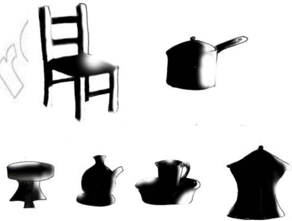
ሥዕል 5.4 የጋራ መገልገያ መሣሪያዎች

“ከዚህ ከማይሞተው የሰው ልጅ ማደጊያ ሥፍራ ግብ!” የሚልጥቅስ በብዙ ትምህርት ቤቶች መግቢያ በር ላይ ተጽፎ ይገኛል። ትምህርት ቤት ሕያው የሆነ የጥበብ መፍለቂያ ሥፍራ ነው። በዚህ የትምህርት ተቋም ውስጥ በርካታ የጋራ መገልገያዎች ይገኛሉ።