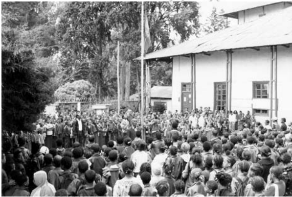
ስዕል 5.5 ተማሪዎች በሰንደቅ ዓላማ ሥነ ሥርዓት ላይ