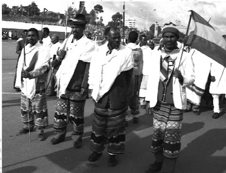
ሥዕል 5.1 የልማት አርበኞች