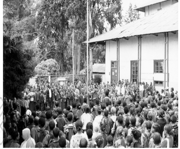
Fakkii 5.3 Barattoonni sirna kabaja alaabaa irratti yommuu argaman