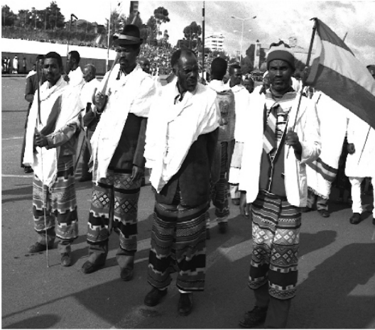
Fakkii 5.1. Ibsitoota Jaalala Biyyaa Keessaa Tokko

Jaalala biyya jechuun, biyya ofiif yaa-duu sirriitti jaalachuu jechuudha. Miseensonni maatii tokko fedhii fi ilaacha adda addaa qabatanillee, akka maatiitti waliigalteen, waljaalala fi waldanda`uun wajjin jiraatu. Miseensonni maatii kun mirga fi dirqama walqixxee qabachuu isaan ni hubatu. Haaluma kana fakkaatuun, saboonni, sablammoonni fi uummatoonni Itoophiyaa aadaa ,afaan fi amantii adda addaa qaban mirga fi dirqama walqixxee qabachuu isaanii heerri keenya mirkaneeseera. Kanaafuu, jaalalli biyya isaanii qaba ol`aanaa ta'a. Daangaan biyya keenyaa sabaa fi sablammootaa