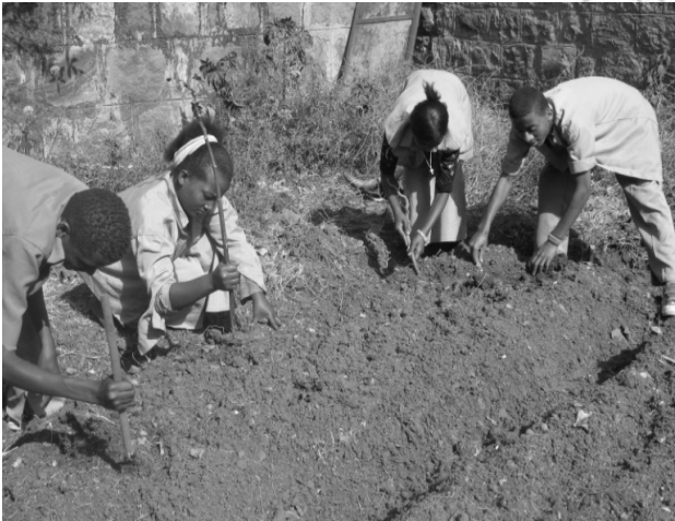
Fakkii 5.2 Waltajjillee jaalala biyyaa itti muuxatan keessaa tokko