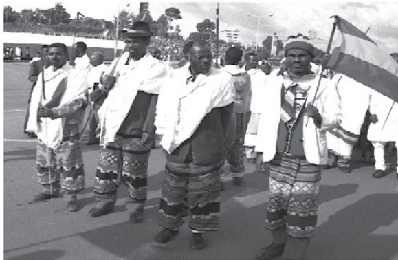
ስእሊ 5.1 ካብ መግለጻት ፍቕሪ ሃገር ኣዲኡ