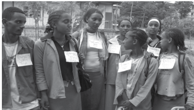
ስእሊ 5.2 ካብ መድረኻት መለማመዲ ፍቕሪ ሃገር ሓደ