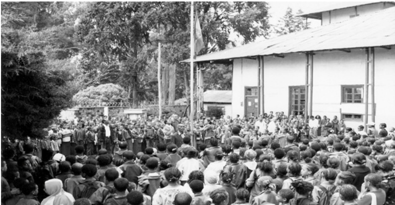
ስእሊ 5.3 ተምሃሮ ኣብ ስርዓት ሰንደቕ ዕላማ