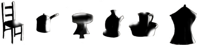
ሰእሊ 5.4 ናይ ሓባር ናውቲ

ሓበራዊ ናውቲ ገዛ ዝበሃሉ ካብ ሓደ ንላዕሊ ንዝኾኑ ሰባት ወይ ጉጅለታት ግልግሎት ዝህቡ መሳርሕታት እዮም። ሓበራዊ ናውቲ ገዛ ንውልቀ ሰባት ጥራሕ ክይኮነ ንብዙሓት ሰባት ዘገልግሉ እዮም።