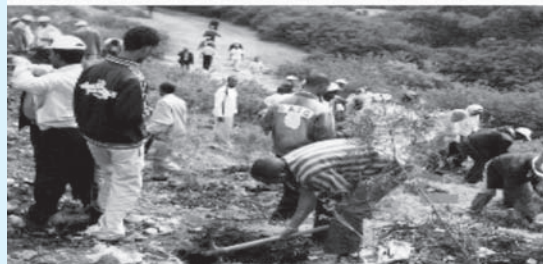
Jaantuska 6.2 waa ka soo bixida masuuliyada ka saran daryeelka agagaarka.