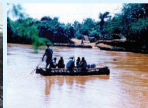
Jaantuska 6.3 Biyo dhaca wabiga Abay iyo Biyaha Wabi Shabeele