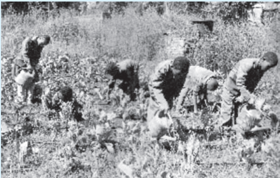
Jaantuska 6.1 Arday dhir-waraabin ka wada dugsigooda