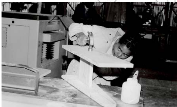
ሥዕል 7.2 በተሰደዩ መደዎች የተሰማራ ሰዎች