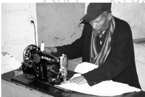
ምዕራ 7.1 በተሰደደ ሙያዎች የተሰማራ ሰዎች በሥራ ላይ