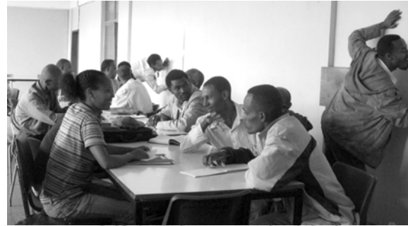
ሥዕል 7.3 የሙያ ሥልጠና