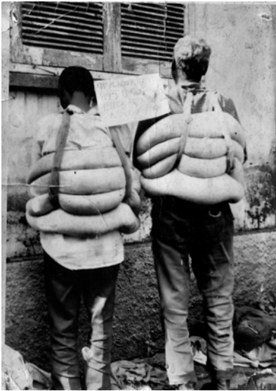
ሥዕል 8.4 ኮንትራባንድ ሀገርን የሚገዳ ተግባር ነው።