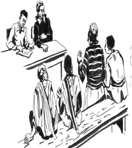
ሥልጠና 8.3 የራስን ሃሳብ ለሌሎች ማሳመን