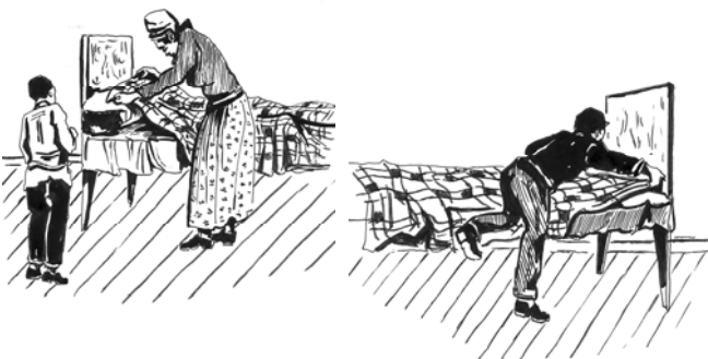
ሥዕል 8.1 ጥገኝነት