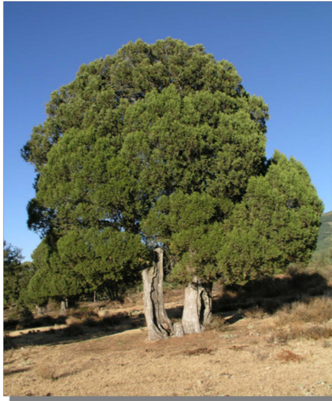
ሰእሊ 3.2 እፅዋት ኢትዮጵያ