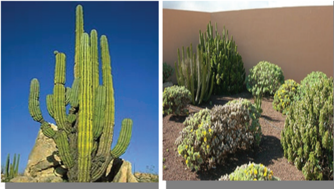
ሰእሊ 3.1 እፅዋት ተፈጥሮ ቀርኒ አፍሪካ