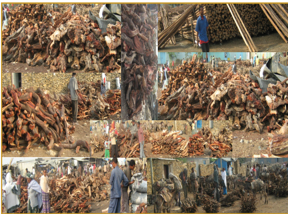
ሰኔሊ. 4.4 አግራብ ብሓይልን ጉልበትን ደቂ ሰባት እንትበርስ