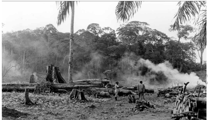
ሰኔሊ. 4.3 አግራብ ንዝተፈላለዩ ረብሓ ብሓዊ እንትበርስ