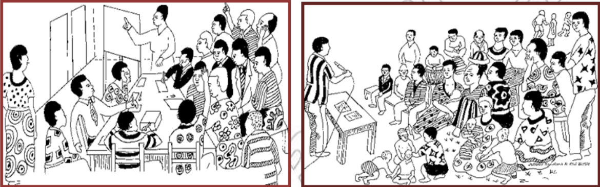
ሰእሊ 4.1 ኣብ ጉዳይ ማሕበራዊ ፀገም ኤች.ኣይ.ቪ/ኤድስ ኣመልኪቶም ማሕበረሰብ ዘተ እንትካይዱ