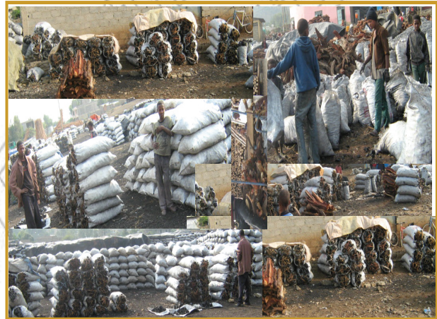
ሰኔሊ. 4.5 ብርሰት ሃፍቲ ተፈጥሮ፣ አግራብ ብሓይልን ጉልበትን ደቂ ሰባት እናበረሱ ናብ ፈሓም እናተለወጡ ኣብ ከተማታት ንመሸባ እንትውዕሉ

በዝሒ ህዝቢ እንትውስኽ ብርሰት ከባቢ ስለዝህሉን መሬት ካብ ፍግረ መሬት ዝግበር ምክልኻል ድኽም ስለዝኸውን ኣብ መጠንን ልምዑነትን መሬት ኣለታ ዘለዎ ይኸውን። ነዚ ዝኾነሉ ምኸንያት መሬት ንምግፋሕ ተባሂሉ ዝበርሱ አግራብ ነቲ ሓመድ ብትሕዝቶ ይኹን ብልሙዕነት ናብ ሓደጋ ክጥሕል ይገብሮ። አግራባት ምህላዎም ብወሑጅን ብነፋስን ክበርስ ዝኸእል መሬት ይከላኸልዮ። ናይዚኦም ምብራስ ግና እቲ መሬት ተጋሕጊሑ ስለዝኸይድ ካብ መፍረያይነት ናብ ባድመ ስለዝልወጥ ኣብ መነባብሮ ገባራት ፀገም ይፈጥር ኣሎ። አግራባት ዝበርሱሉ ኩነታት ንረብሓ ተሓራሳይ መሬት፣ ንገዛ መስርሒ፣ ንምግቢ መብሰሊ ብምሕሳብ እንትኾን እዚ ድማ ኣብቲ ከባቢ ዘሎ በዝሒ ህዝቢ እንትውስኽ ድልዮትን ጠለብን ከምዝገህር ይእመን።