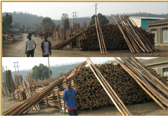
ሰኔሊ. 4.2 አግራብ በሪሶም ናብ ዝተፈላለዩ ስራሕቲ እንትውዕሉ