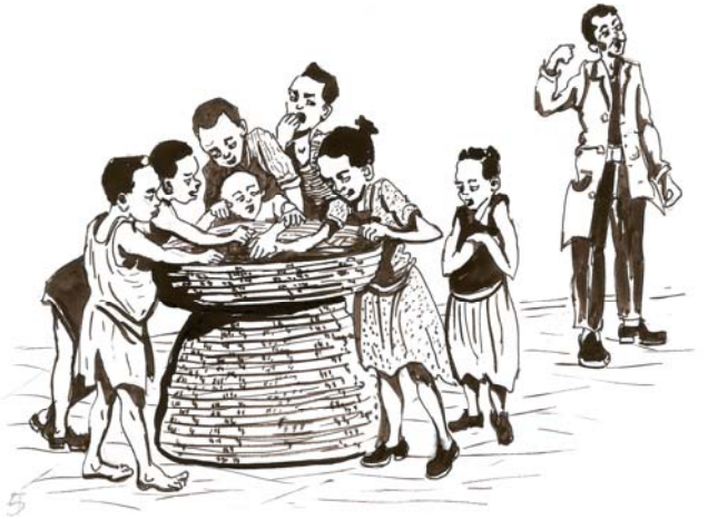
ሥዕል 9.1 ቁጠባን የሚጻረሩ ሁኔታዎች