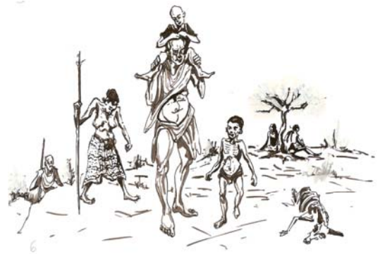
ሥዕል 9.2 ከድህነት ገፅታዎች አንዱ