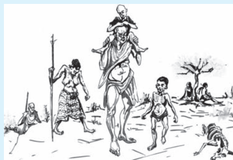
Jaantuska 9.2 Astaamaha Saboolnimada