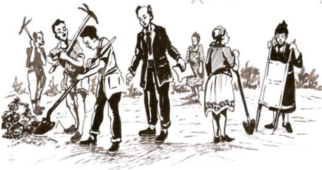
ምዕራፍ 10.2 የህብረተሰብ ተማትፎ በስነ-ምግባር ልማት ሥራ ላይ