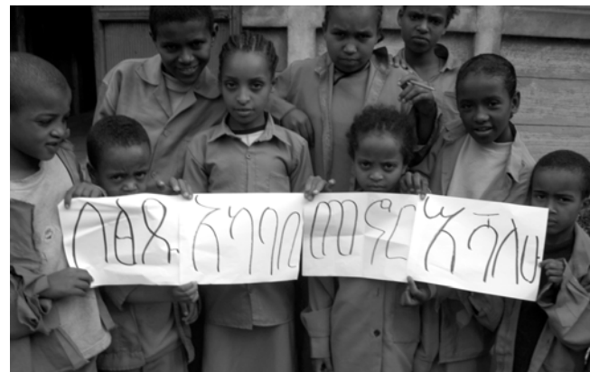
ሥዕል 10.5 በጸዳ አካባቢ የመኖር መብታችን ይከበር

(ከአዲስ ዘመን ጋዜጣ ጥር 25 ቀን 2000 ዓ.ም. ገጽ 2 እንዲሰማማ ተደርጎ የተወሰደ።)