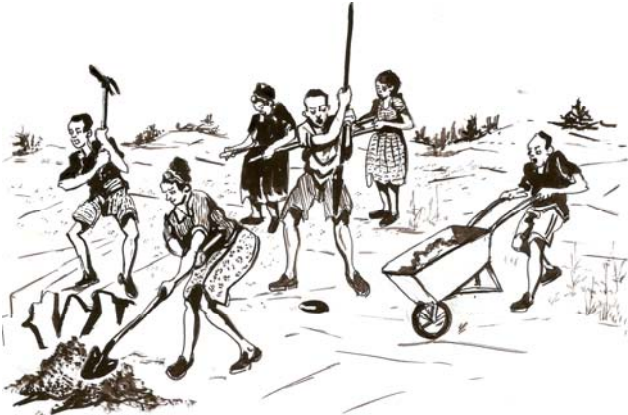
ምዕራፍ 10.1 የሥራ ዘመቻ በትምህርት ቤት