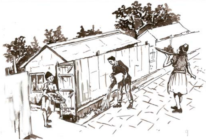
ሥዕል 10.3 የአካባቢ ብክሳ