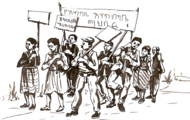
ሥዕል 10.4 የአካባቢ ብክለትን የመቃወም እንቅስቃሴ