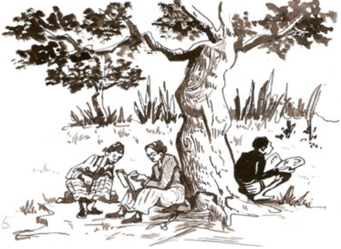
ስእሊ.11.6 ንባብ ኣብ እግሪ ኦም