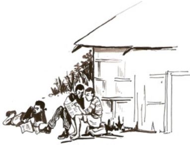
ስእሊ 11.5 ንባብ ኣብ እግሪ ዛቤባ ገዛ