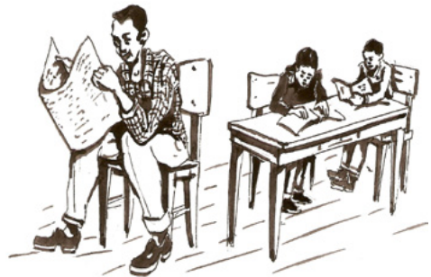
ስእሊ 11.2 መጻሕፍትን ጋዜጣታትን ፍልፍላት ፍልጠት እዮም፡፡