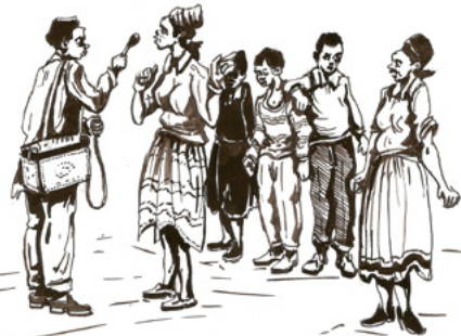
ስእሊ 11.3 ሰባት ፍልፍል ፍልጠት እዮም፡፡