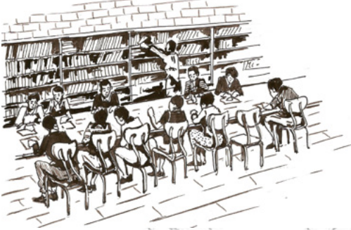
ስእሊ.11.4 ንባብ ኣብ ቤት መፃሕፍቲ