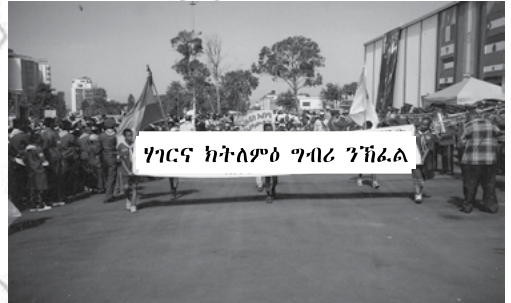
ስእሲ 1.1 ረብሓታት ሰብኣውን ዴሞክራሲያውን መሰላት