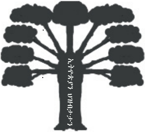
ሰእሊ 1.2 ብሄራት፣ ብሄረሰባትን ህዝብታትን ኢትዮጵያ