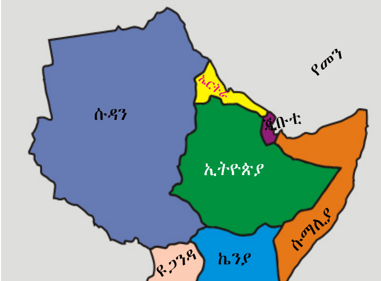
ካርታ 1.3 ኢትዮጵያን ጎረባብታን