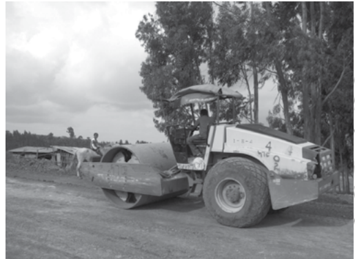
ሰእሊ 1.4 መሰረታት ፖሊሲ ርክብ ወፃኢ ኢትዮጵያ