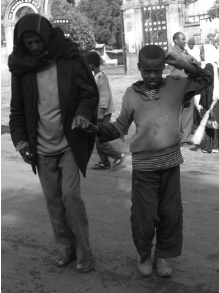
ሥዕል 2.1 ሕዝቡን ተኮሮ መርዳት ለአንድ የሥነምግባር መገሰጫ ነው።