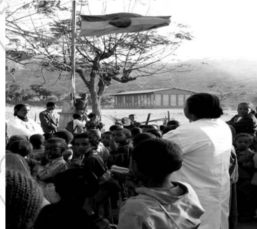
Fakkii 2.1 Naamusa Qajeelfama jireenya keenyaa haa gonnu!