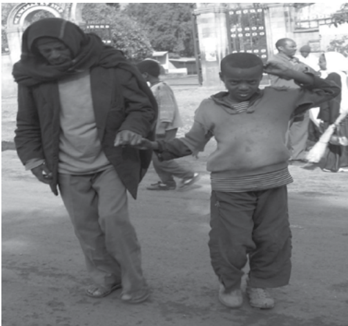
ስእሊ 2.1 ሰብ ፀጋ ዕድመ ምሕጋዝ ሓዳ መምርሒ መግለፂ ስነምግባርዩ