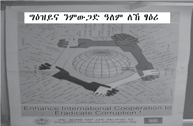
ስእሊ 2.3 መ-ሰና ልዕልነት ሕጊ ከይኸበር ይገብር