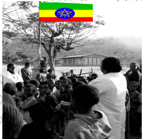
ስእሊ 2.2 ሰናይ ስነምግባር መሰረት ህይወትና ንግበር