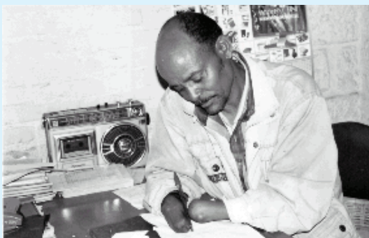
Sawir 3.4 Naafadu sida muwaadiniinta kale ayay wax soo Saar leyihiin.