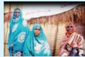
Jaantuska 3.3 Dumar Soomaaliyeed

Waayahan dambe aad ayaay xaaladaan is ku badashay oo waxaa jira in tirade Dumarka ee ku soo biirayso goobaha waxbarashada ay aad usoo kor dhayso. Gaar ahaan dugsiyada hoose gobo lada qaar kood Gabdhaha ayaaba ka baddan Wiilasha, halka dugsiyada dhexe/sarane ay aad usoo kor dhayso tirada Hablaha.