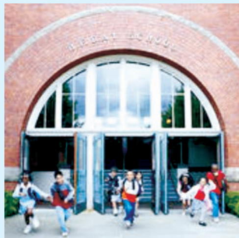
Jaantuska 3.1 Dugsiyada Waa xarun aanu ka wada faa'iidaydaha