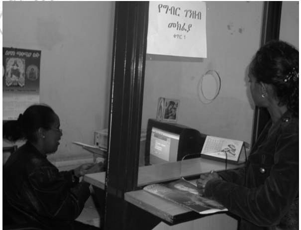
ሥዕል 4.2 ግብር መክፈል የዜግነት ግዴታ ነው።