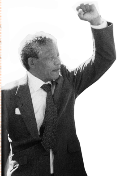
ሥዕል 4.1 ኔልሰን ማንዴላ

በዘመኑ ደቡብ አፍሪካዊ ጥቁር ሕዝቦች በጥቂት ነጮች አገዛዝ ከፍተኛ በደል ይደርስባቸው ነበር። ከተፈጸሙ መድሎዎች መካከል የሚከተሉት በምሳሌነት የሚጠቀሱ ናቸው።