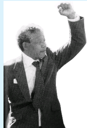
Jaantuska 4.1 Nelson Mandeela

Xiligaas dalka kuunfur Afrika waxaa ka jiray nidaam la odhanjiray midab takoorka. Waxaane xukumijiray dad Cadaan ah.