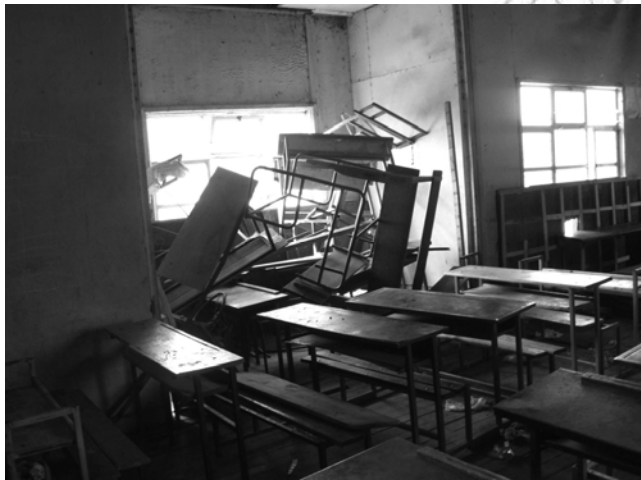
ሥዕል 5.2 በግዴላሽነት የተገቡና የተሰባበሩ የጋራ መገልገያዎቻችን

በሁለተኛው ክፍል ውስጥ በግዴላሽነት የተሰባበሩ ወንበሮች፣ ጥቁር ሰሌዳዎች፣ ዴስኮችና የቤተ መከራ ዕቃዎች ተሰብስበዋል። በግድግ ዳውም ላይ “በግዴላሽነት የተገቡና የተሰባበሩ የጋራ መገልገያዎቻችን” የሚል ጽሑፍ ይነበባል።