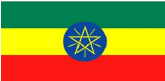
ሥዕል 5.8 የኢትዮጵያ ሰንደቅ ዓላማ