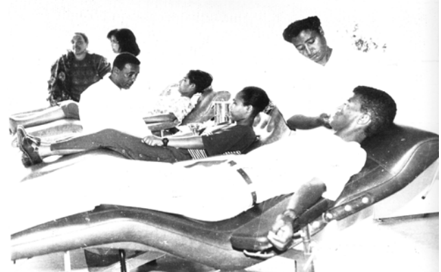
ሥዕል 5.7 የቡን ተግባር የዜጎች የውዳታ ግዳታ ነው