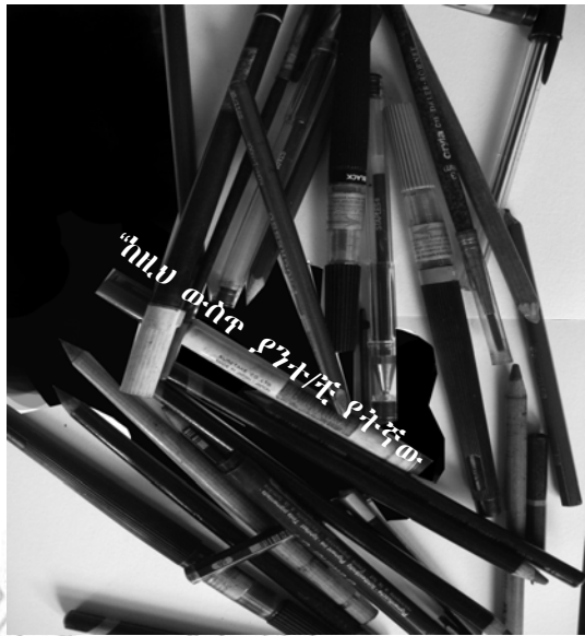
ሥዕል 5.3 የገነፈሉና የተሰባበሩ እስክሪፕቶችና እርሳሶች

በሦስተኛው የትርጓሜ ማሳያ ክፍል ተማሪዎች በጫጭቀው የጣሏቸው ደብተሮች፣ የገነፈሉ እስክሪቢቶችና ቁርጥራጭ እርሳሶች ተሰብስበው ይታያሉ። በግርግዳውም ላይ “ከዚህ ውስጥ ያንተ/ቺ የትኛው ነው?” የሚል ጽሑፍ ተጽፏል።