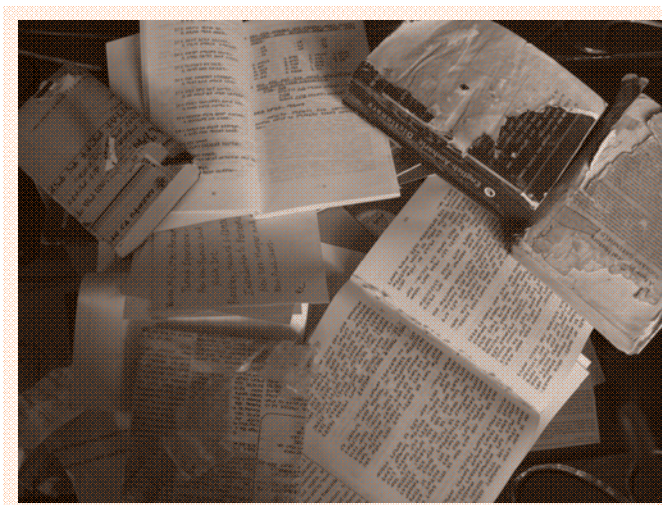
ሥዕል 5.1 የተገነጣጠሱና የተቀዳደዱ መጻሕፍት

በሁለተኛው ክፍል ውስጥ በግዴላሽነት የተሰባበሩ ወንበሮች፣ ጥቁር ሰሌዳዎች፣ ዴስኮችና የቤተ መከራ ዕቃዎች ተሰብስበዋል። በግድግ ዳውም ላይ “በግዴላሽነት የተገቡና የተሰባበሩ የጋራ መገልገያዎቻችን” የሚል ጽሑፍ ይነበባል።