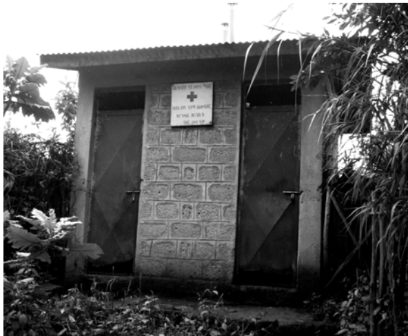
ሥዕል 5.5 የጋራ መጻዳጃ ቤቶች ንጽሕናቸው የተጠበቀ መሆን አስበት