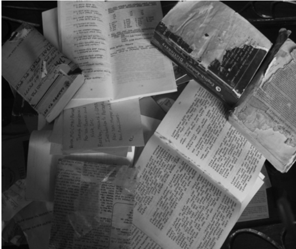
Fakkii 5.1 Kitaabilee babbaqaanii fi manca'an

mul'ata. Dhaaba mana kitaabaa irratti barreeffamni "dhaloonni nu gaa-fata" jedhu barreeffameera.