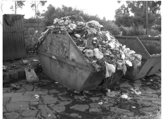
Fakkii 5.4 Balfaan haalaan yoo gatamuu baate fayyaa irratti rakkoo fida.