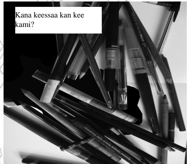
Fakkii 5.3 Qalamootaa fi qubeessaa bulga'ee fi cacca be

kanaa irratti barreeffamni "kana keessaa kan kee isa kam?" jedhu barreeffameera