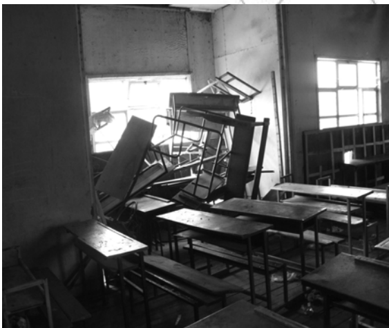
Fakkii 5.2 Teessumaa fi minjaalota caccaban

Agarsiisa kutaa lammaffaa keessatti immoo eegumsa dhabuu irraa kan ka'e meeshaalee caccaban kan akka teessoo, gabatee gurraacha, minjaalotaa fi meeshaaleen mana yaalii walitti qabamaniiru. Dhaaba kutaa kanaa irratti <<Meeshaaleef of eeggannoo gochuu dhabuun nu jalaa caccaban>> jedhu ni jira.