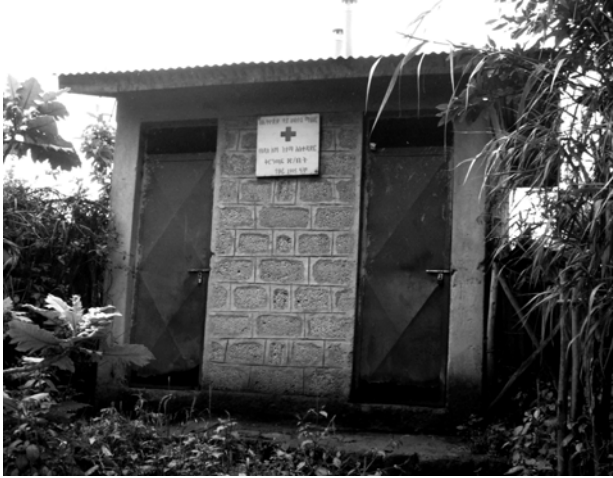
Fakkii 5.5 Manni fincaanii waliin fayyadaman qulqullini isaa egamuu qaba