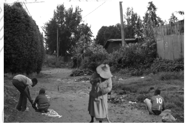
Fakkii 5.7 Tajaajila fedhii irratti hundaa'e kennuun dirqama lammummaa ti.