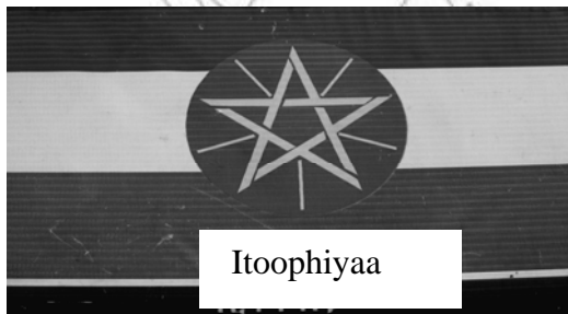
Fakkii 5.8 Alaabaa Biyyoolessaa Itoophiyaa