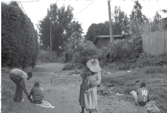
ስእሊ 5.7 ብዓርሶ ተበግሶ ግልጋሎት ምሃብ