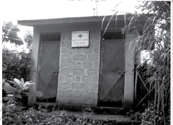
5.5 ናይ ኣባር ሽቓቕ ፅሬቲ ዝተሓለወ ክኸውን ኣለዎ