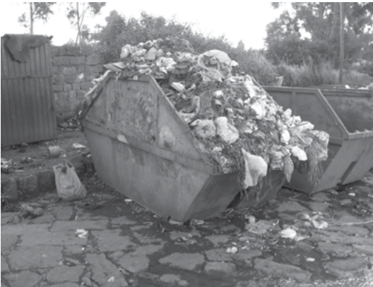
ስእሊ 5.4 ኅሓፍ ብኣግባቡ እንተዘይተወጊዱ ኣብ ጥዕና ጠንቂ ይፈጥር