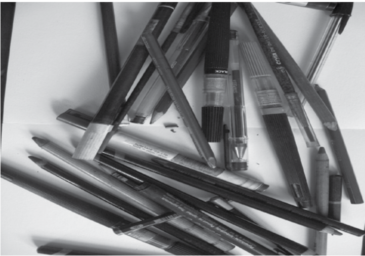
ሰእሊ 5.3 ዝገንፈሉን ዝተሰባበሩን እስክርቢቶታትን እርሳሳትን

አብቲ ሳልሳይ ክፍል ዓውድ ርእይ ተምሃሮ መንጨቶም ዝደረበይዎም ደፋተር ዝገንፈሉ እስክርቢቶታትን ቁርፅራፅ እርሳሳትን ተአኪቦም ይርኣዩ። አብቲ መንደቕ “ካብ እዚአቶም ናትካ/ኪ ኣይናይ እዩ? ዝብል ፅሑፍ ይንበብ።