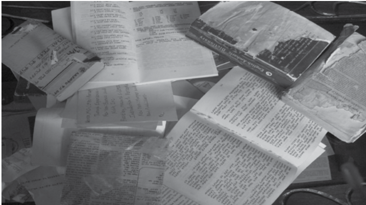
ስእሊ 5.1 ዝተቐዳዱን ዝተነፀሉን መጻሕፍቲ

ቀዳማይ ክፋል እቲ ምርኣት ዝቐረበ ኣብ ቤተ መጻሕፍቲ እቲ ቤት ትምህርቲ እዩ። ብዋና ቦሪ እቲ ቤተ መጻሕፍቲ እንትእቶ ዝተቐዳደዱን ስእሎም ካብ ውሽጦም ተገንጺሉ ዝተወሰደን ብዙሓት መጻሕፍቲ ይረኣዩ ኣለዉ። ኣብቲ መንደቕ “ወለዶ ይፍረደና” ዝብል ዕሑፍ ተጻሒፉ ኣሎ።