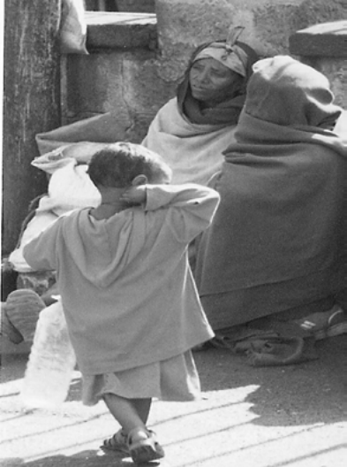
ስእሊ 5.6 ብንጥፊት ብምስራሕ ድኽነት ክወገድ ይክእል።