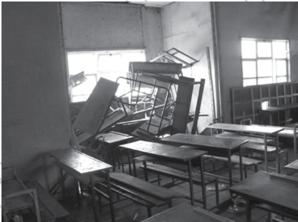
ስእሊ 5.2 ብዕሽሽታ ዝተጎድኡን ዝተሰባባሩን ናይ ሓባር መገልገልታት

ኣብ ካልኣይ ክፋል እቲ ዓወደ ርእይ ብዕሽሽታ ዝተሰባባሩ ወናብር፣ ፀለምቲ ሰሌዳታት፣ ዴስክታትን ናውቲ ቤተ ፈተነን ተኣኪቦም ኣለዉ። ኣብቲ መንደቕ “ብዕሽሽታ ዝተጎድኡን ዝተሰባባሩን ናይሓባር መገልገልታት” ዝብል ዕሑፍ ይንበብ።