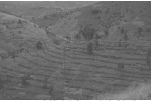
ሥዕል 6.3 የአፈር መቃጠብን ለመከላከል የእርከን ሥራ በኮንሶ ከሁለቱ ስዕሎች ምን ተማራችሁ?