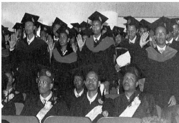
ሥዕል 6.1 በሕክምና ሙያ ተመራቂ ወጣት ህኪሞች ቃል መሀሳ ሲፈጽሙ