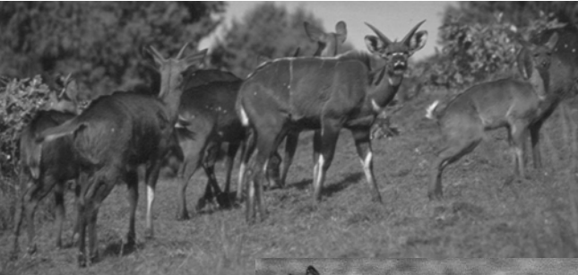
ሥዕል 6.4 የባሌ ተራሮችና በውስጣቸው የያዘው የዳር እንስሳት

ከሃያ በላይ የአጥቢ አራዊትና ከአንድ መቶ አርባ በላይ የአእዋፋት ዝርያዎችን በውስጡ አቅፎ የያዘው ይኸው ፓርክ በልዩ ልዩ ሀገር በቀል እጽዋት ደኖች የተሸፈነ ነው። በዓለም ውስጥ በየትኛውም ሀገር የማይገኙ ሃያ አራት የአእዋፋት ዝርያዎች በሀገራችን ብቻ ይገኛሉ። ከነዚህም መካከል አስራ አራቱ ብርቅዬ የወፎች ዝርያ የሚገኘው በባሌ ተራሮች ፓርክ ውስጥ ነው።