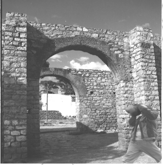
ሥዕል 6.2 የሐረር ግንብ ጥገና ሲደረግለት