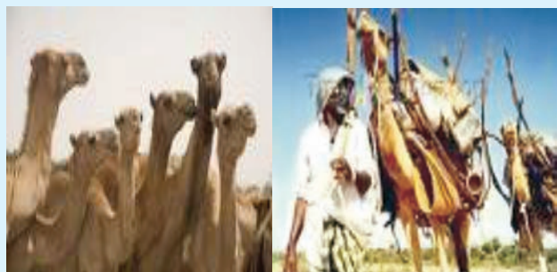
Jaantuska 6.3 Tusaale Geela Deegaanka Soomalida

daaqsin, dooxooyin, macdano kala duwan sida shidaalka, Milixda, iyo kuwa kale. Haddii aynan si haboon uga faa'iiaysano khayraadkaasi dadkeenu Kama baxayaan saboolnimada. Sidaas daraadeed, waa masuuliyadeena in aan baraarujiro dadkeena in ay hurdada ka kacaan kana faa'iidaystaan khayraadkaas