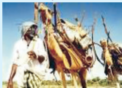
Jaantuska 6.2.b Tusaale Dhaqanka Soomalida