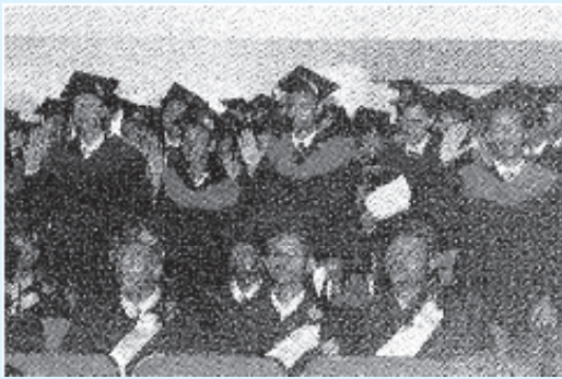
Jaantuska 6.1 Arday Ka qalin jabisay Xirfada Caafimaadka oo Balan Qaadaya