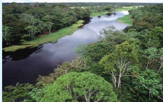
Jaantuska 6.4 Khayraadka Dabiiciga ah