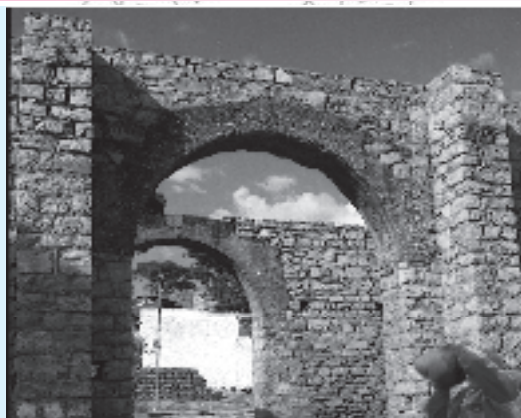
Jaantuska 6.2 a Dayrka Taarikha ah Ee Harar