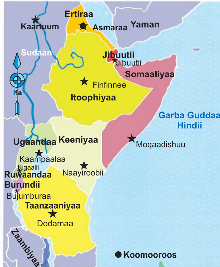
Fakkii 1.1. Argama Naannoo Baha Afrika

Argama naannoo Baha Afrikaa fakkii 1.1 irraa sirriitti hubattee? Wantoonni kallattii adda addaatiin naannicha daangessan maal fa'a? Naannoon Baha Afrikaa naannoolee qaama ardii Afrikaa ta'an sadii fi qaamman bishaana'oo garaagaraatiin daangeffamee argama. Naannooleen kunniinis naannoo kaaba Afrikaa, naannoo Afrikaa jiddugaleessaa fi naannoo kibba Afrikaati.