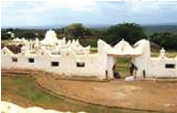
Gamoo Dirree Sheek Huseen