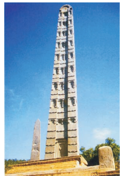
Fakkii 1.3. Siidaa Aksum

Qaroomina Aksum keessatti wantoonni xiyyeeffannoo Addunyaa harkisan waa hedduutu jiru. Isaan keessaa Siidaan Aksum isa tokko.