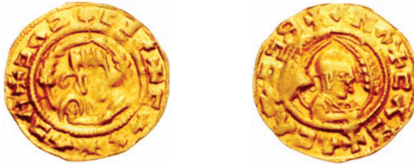
Fakkii 1.4. Saantima Bara mootummaa Aksum

Dabareewwan seenaa Aksum keessaa inni tokko siidaa Aksum. Akkaataa siidaan kun itti hojjatame tilmaamuun baayyee nama rakkisa. Sadarkaa qarroominaa yeroo sanaa keessatti hawaasni sun siidaa kana hojjachuun isaa addunyaa ni raajeffachiisa. Kana malees, gamoowwan adda addaa yeroo sana hojjataman ni argamu.