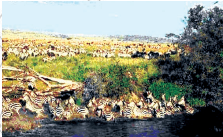
Fakkii 3.1. Sochii haree corree waqtiin muldhatu

Geem Paarkii Maasaayi Maaraa: Gara kibba-dhiha Keeniyaa Taanzaaniyaa wajjin wal daangessu irratti argama. Paarkiin kun lafa baldhina 1,510 km 2 ta'e irratti kan hundeeffameedha. Paarkiin kun karaa kibba dhihaatiin Paarkii Sarangeetii biyya Taanzaaniyaa keessatti argamu wajjin wal daangessa. Paarkonni Maasaayi Maaraa fi Sarangeetii walitti fufanii argamuun bineensota margaa fi bishaan barbaaduuf waqtiin socho'an akka Paarkii keessaa hin baane gochuuf gargaareera. Akka qo'annaan muldhisutti paarkoota kanneen keessa bineensonni gara miliyoona lamaatti tilmaamaman margaa fi bishaan argachuuf waqtii eeganii kan socho'an ta'uun isaanii hubatameera. Kana keessaa kan gara 200,000tti tilmaamamu harree corree (zebra) dha. Bineensonni kunniin ji'oota Adoolessaa fi Hagayya keessa haala ajaa'ibsiisaa ta'een wal hordofanii lafa Maasaayi Maaraa baldhaa fi dhukkeen guutame keessa gara kallatti kaabaatti godaanu. Ji'a onkoloolessaa keessa immoo akka gosa gosa isaaniitti wal harcaasaa gara kallattii kibbaatti socho'uun Paarkii Sarangeetiitti dhufu.