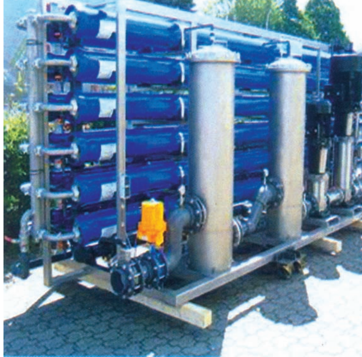
Fakkii 3.4. Maashinii bishaan xuraa’aa qulqulleessu