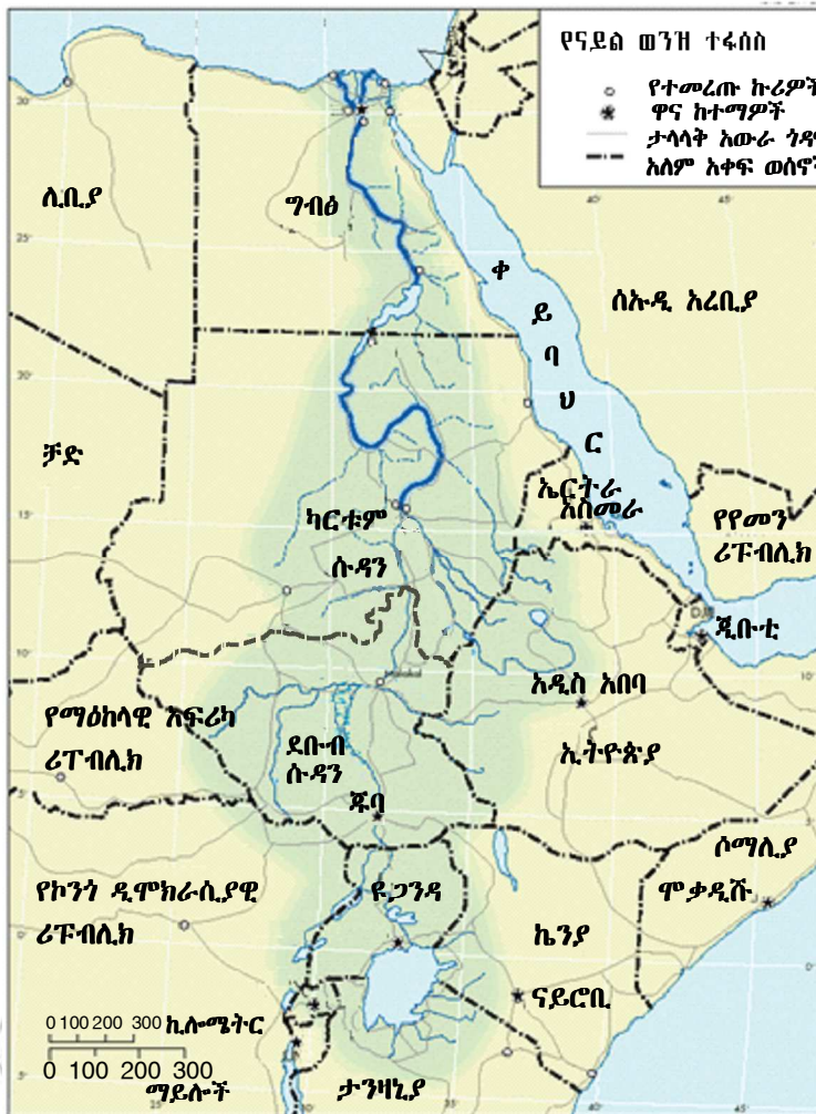
ምሥል 4.6 የናይል ተፋሰስ

ከ1990 ጀምሮ ይህን የተዛባ የውኃ አጠቃቀም ለመለወጥ ሙከራ ተደርጎ ነበር። ሙከራው የተጀመረው የናይል ተፋሰስ ኢኒቬቲቭ በሚል ድርጅት ነበር። ድርጅቱ የኮሬንቲ ኃይል የመጠቀም፣ የውኃ ሀብት አጠቃቀም አግባብነትና የአካባቢ ጥበቃን በተመለከተ በጋራ ኘሮጀክቶች እውን መሆን ላይ የሚሠራ ነው። እነዚህን ኘሮጀክቶች እውን ለማድረግ እ.ኤ.አ. ከ1990ዎቹ ጀምሮ የተለያዩ ጉባኤዎች ተካሂደዋል። በቅርቡ ማለትም እ.ኤ.አ. በ2009 በግብፅ የድርጅቱ ስብሰባ ተካሂዷል። በዚህ ጉባኤ የናይል ወንዝን በእኩልነትና ፍትሐዊ በሆነ መንገድ ለመጠቀም የሚያስችል ረቂቅ የስምምነት ሰነድ ይፈርማል ተብሎ ተገምቶ ነበር። ሆኖም ግብፅና ሶሜን ሱዳን ስምምነቱን ለመፈረም ፈቃደኛ አልሆኑም። ይሁን እንጂ ከግማሽ በላይ የሚሆኑት የተፋሰሱ አባል ሀገሮች የስምምነቱን ሰነድ ፈርመዋል። የግብፅና የሱዳን መንግሥታትም አዲሱን የተፋሰሱን ስምምነት ለመፈረም ፈቃደኝነታቸውን አሳይተዋል።