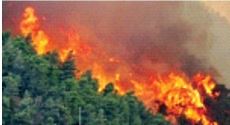
ምሥል 4.4 የደን ቃጠሎ

የስልክ ጥሪ ማድረግ አስፈላጊ ነው። ይህን ጥሪ ለማድረግ የእሳት አደጋ መከላከያን የስልክ አድራሻ በቃል መያዝ ይጠቅማል።