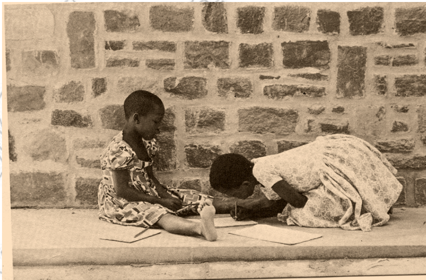
ምሥል 4.1. ምቹ የመማሪያ ሥፍራ ያላገኙ ልጆች