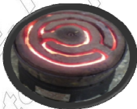
ምሥል 4.3 የኮራንቲ ምድጃ

ኮራንቲ ብርሃን ለመስጠት፣ ሙቀት ለማስገኘትና ሞተሮችን ለማንቀሳቀስ ይጠቅማል። ይህ በጣም ጠቃሚ ቴክኖሎጂ ከፍተኛ አደጋ የማድረስ ወይም ጥፋት የመፍጠር አቅም አለው። የኮራንቲ ፍሰትን ጥቅም ላይ ለማዋል በመዳብ ሽቦዎች እንጠቀማለን። ሁሉም ብረት ነክ ነገሮችና እርጥብ ነገሮች የኮራንቲ ፍሰትን ያስተላለፋሉ። የኮራንቲ ፍሰት በሰው አካልም ይተላለፋል። ስለዚህ የኮራንቲ ፍሰት የሚያስተላልፉ የፕላስቲክ ሽፋን የሌላቸውን ሽቦዎች መንካት፣ ሽቦዎችን በእጅ ማገናኘት፣ በእርጥብ እንጨት የተላጡ የኮራንቲ ሽቦዎችን መንካት እንዲሁም የመብራት ቆጣሪን ሳያጠፉ በድፍረት የኮራንቲ ገመዶች መቀጠል፣ መጠጠስ እንዲሁም በኮራንቲ ኃይል የሚሠሩ ዕቃዎችን በእርጥብ እጅ መንካት በሕይወት ላይ ከፍተኛ አደጋ ያስከትላል። ስለዚህ የተላጡ ሽቦዎችን ከመንካት መቆጠብ አለባችሁ። ድንገት የተላጡ ሽቦዎች ቢገኙ ወዲያውኑ ለአዋቂዎች ወይም ለሚመለከታቸው ሰዎች መንገር ይገባችኋል። በእርጥብ እንጨት ወይም ውኃ በነካ እጅ በኮራንቲ የሚሠሩ ዕቃዎችን ወይም የኮራንቲ ሽቦዎችን ከመንካት መቆጠብ አለባችሁ። የተላጠ የኮራንቲ ሽቦ ካለበት አካባቢ ራሳችሁን በማራቅ ከአደጋ ማምለጥ ትችላላችሁ።