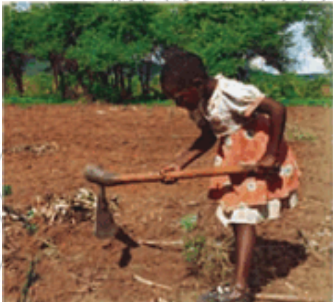
ከዚህ ምሥል ምን ትረዳላችሁ?