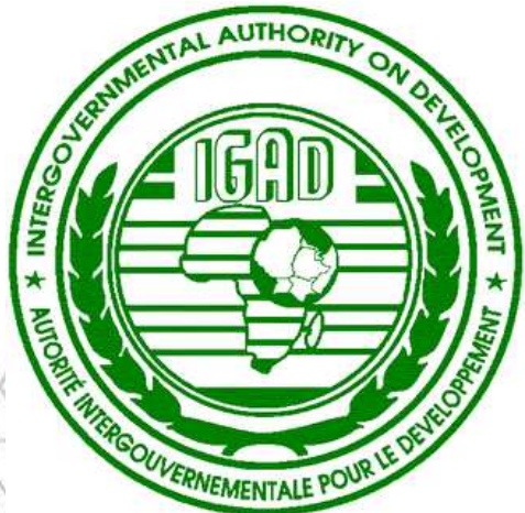
ምሥል 4.5 የኢጋድ አርማ

ይህ ድርጅት የተቋቋመው እ.ኤ.አ. በ1986 ዓ.ም ነበር። ይህ ክፍለ አኅጉራዊ ድርጅት የተቋቋመው ሁሉም የምሥራቅ አፍሪካ ሀገሮች ከፍተኛ ድርቅ ባጋጠማቸው ወቅት ነበር። በዚያን ወቅት ከድርጅቱ ዓላማዎች አንዱ ድርቅ ያስከተለውን ችግር መቋቋም ነበር። ስለዚህ የድርጅቱ ስያሜ ልማትን የሚያራምድና ድርቅን የሚቋቋም በሀገሮች የጋራ ትብብር የተቋቋመ ድርጅት የሚል ነበር። ስያሜውም በዚህ (IGADD) ምሳሌ ቃል ይታወቅ ነበር። በኋላ ግን ድርጅቱ ድርቅ ላይ ብቻ ሳይሆን የክፍለ አኅጉሩን ችግሮች ለመፍታት በልማት ተግባራት ላይ አተኩሯል። ስለዚህ ከስያሜው ውስጥ “ድርቅ” የሚለውን አስወግዷል። በመጀመሪያ የድርጅቱ አባል ሀገሮች ቁጥር ስድስት ነበር። እነርሱም ጂቡቲ፣ ኢትዮጵያ፣ ኬንያ፣ ሶማሊያ፣ ሱዳንና ዩጋንዳ ነበሩ። ኤርትራ ራሷን ችላ አገር ሆና መኖር ከጀመረችበት ጊዜ አንስቶ ግን የኢጋድ አባል አገሮች ቁጥር ሰባት ደርሶ ነበር። ነገር ግን ኤርትራ ራሷን ከድርጅቱ አግልላለች።