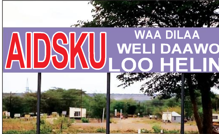
Jaantuska 4.1: Astaanta kahortaga AIDS ee Deegaankeena

Fasalka shannaad waxaad ku soo barateen in HIV/AIDS-ku yahay halis aad u daran oo ku wajahan jiritaanka aadamaha ee dunida. Wuxuu saamayn ku leeyahay xaaladaha bulsho-dhaqaale. HIV/AIDS wuxuu aafeeyay: shaqsiyaad, qoysas, Bulsho iyo dalal.