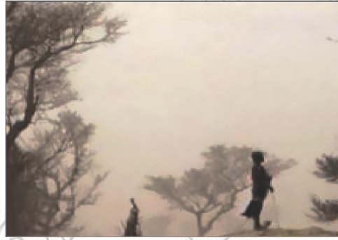
Jaantuska 4.7: (A) Abaar baabisay saaxil (B) dhulka qalalan ee lama – degaanka ah

Dhir xaaluf, Daaqsin xad-dhaaf ah iyo qodaal xad-dhaaf ahi waa dhaqdhaqaaqyada ugu waawayn ee aadmigu sababo, taasoo ku xidhan korodhkiisa xawliga ah. Waana kuwa sababa xaalufka wayn (lama dagaanada oo balaadha iyo cimilada) oo dabadeed laga dhaxlo gaajo iyo Abaar.