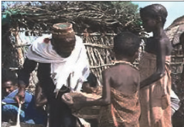
Jaantuska 4.6: xarun quudin ah oo Soomaaliya ku taal

Tusaale ahaan: laga bilaabo horaantii 1960' dii dalka Itoobiya wuxuu soo maray waxsoosaarkii cuntada oo hoos u dhacay. Xaaladuna waxay kasii dartay badhtamihii 1970' dii oo dalka oodhan cunno dibada looga keenay iyo mid dalku lasoo dagayba. Tusaale ahaan wax soosaarkii wuxuu hoos udhacay qiyaastii 1.9 kintaal 1982 kii ilaa 1983 kii na ilaa 1.5 kintaal 1988 ilaa 1989kii tirada dadku waxay korodhay 2.9% oo ah sannad kiiba Hadaba sannadahaas intii u dhaxaysay celceliska sannadlaha ah ee raashinka deeqda ah waxay gaadhay 54.8 milyan oo kintaal laakiin baahidii waxay noqotay 91.9 milyan oo kintaal. Waana farqi wayn oo u dhexeeya isu dheelitirka dalagyada raashin ee aynu la soo dagayno iyo kuwa deeqda ah ee inooga imanaya Yurub iyo Ameerika.