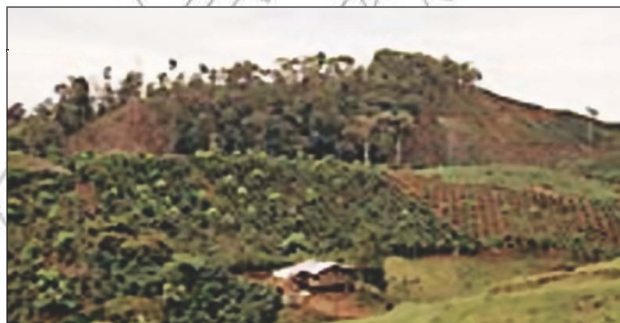
Jaantuska 4.2: Dhirxaaluf