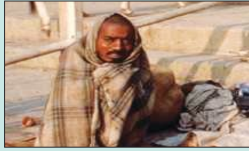
Jaantuska 4.5: Dadka Hoyga iyo Hu'gaba aan haysan ee magaalooyinka dunida saddexaad