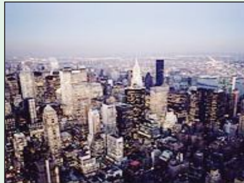
Jaantuska 4.4: (b) meel beer ah oo miyi kutaal (i) magaalo warshadeed

Labada goobood teebaad u malaynaysaan inay ka wasakhow badan yihiin biyaha iyo hawadaba? Faah faahiya sababta?