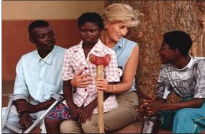
Jaantuska 4.8: Caruur naafo ah

Qaraxyada miinooyinka waxay qariyeen oo ay dileen dad badan oo shacab ah sannado badan kadib goobihii lagu dagaalamay.