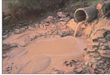
Jaantuska 4.3: Hawada iyo Biyo wasakhowga ay dadku sababeen

Wasakhawga biyaha iyo hawada ee ay dadku sababaan waxay ka dhacdaa Guryaha, warshadaha, baabuurta, dhul-beereedyada i.w.m Waxaa kale oo jira dhibaatooyin ay sababeen dhacdooyinka rabbaaniga ah sida Qaraxa Foolkaanaha, Dabka qabsada duurka. I.w.m