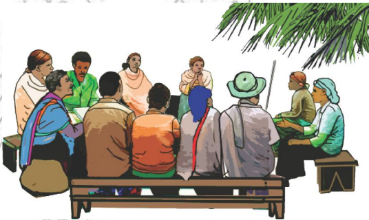
ስእሊ 4.1 ምይይጥ ኣብ ዙሪያ ኤች.ኣይ.ቪ/ኤድስ

ሕማም ኤች.ኣይ.ቪ/ኤድስ ማሕበራውን ኣካላውን ፀገም ስለዘለዎ ነዚ ዝኸውን ፍታሕ ድማ ካብ ኩሎም መንግስታውን ዘይመንግስታውን ትካላትን ሕብረተሰብን ዝተዋደደ ፃዕሪ የድሊ። ዝተዋደደ ፃዕሪ ሕብረተሰብ ድማ ንኤች.ኣይ.ቪ/ኤድስ ሻይረስ ሕሙማት ዝኾኑ ግቡእ ክትትል፣ ድጋፍን ክንክንን ክግበረሎም ወሳኛይ ተራ ኣለዎ። ብመሰረት'ዚ ካብ ሕብረተሰብ ክግበሩ ዝግበኦም ድጋፍ፣ ክትትልን ክንክንን ዝምልከቱ ኣገደስቲ ነጥብታት ዝስዕቡ'ዮም።