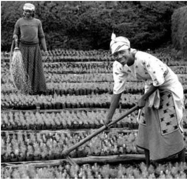
ሰእሊ 4.2 ዳግመ ግረባ ንምክያድን ፈልስታት ኣብ ምትካልን ተሳተፎ ደቂ ኣንስትዮን

ቕልጠፍ ዕብዮት በዝሒ ህዝቢ ኣብ ማሕበረ ኢኮኖሚያውን ከባቢያውን ከንታት ኣብዩ ፅልዎ ኣለዎ። ምስ ምጉሕገሕን ብርሰትን ሃፍቲ ተፈጥሮውን ብቐጥታ ዝተኣሳሰረ እዩ። ሃፍቲ ተፈጥሮ ማለት ኣብ መሬት ዝርከቡን ንራብሓ ሰባት ክውዕሉ ዝክእሉ ከምኡ ማዕድን፣ ደን፣ ሃፍቲ ማይ፣ ወዘተ ዝእምሰሉ እዮም። ናይ ሓንቲ ሃገር ሃፍቲ ተፈጥሮ ኣብ ራብሓ ንምውግል ዝተፈላላዩ ቴክኖሎጂን ዝሰልጠነ ሃይሊ ሰብ የድሊ። እዙይ ድማ መሰረታዊ ግልጋሎት ወሃብቲ ከምእኒ ቤት ትምህርቲ ጥዕና ወዘተ ዝመሳሰሉ ንክማልኡ ግድን ይኸውን። እዚኦም ንምምላእ ድማ በዝሒ ህዝብን ኢኮኖሚያዊ ምዕባለን ክመጣጠን ኣለዎ። ዕብዮት ህዝቢ ኣብ ኢኮኖሚያዊ ምዕባለ ንላዕሊ ኣብ ዝኾነሉ ከንታት ለውጥን ዕብዮትን ክመፅእ ስለዘይክእል ኣብታ ሃገር ዘሎ ሕብረተሰብ ሃፍቲ ተፈጥሮ ኣብ ምብራሕ ክዋፈሩ ይገብር።