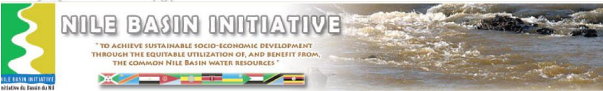
ስእሊ 4.2 ኣርማ መድረኽ ሃገራት ተፋሰስ ናይል

ተምሃሮ ብዛዕባ መድረኽ ሃገራት ተፋሰስ ፍባ ናይል እንታይ ትፈልጡ? አብዚ መድረኽ ሃገራት ተፋሰስ ፍባ ኣባይ (ናይል) ዝምልከተን ተሳተፍቲ ሃገራት እንመንየን?