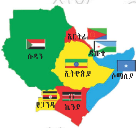
ካርታ 4.1 ኣባል ሃገራት ኢ.ጋድ

Xz! D¥ 'B NGDN ÆNKIN BSF/T Ztኣtw s%? ኾYn# ኣI OYV