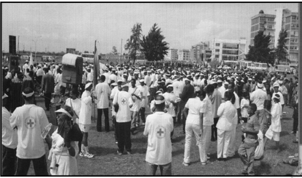
Fakkii 10.6 Guyyaa ayyaana Fannoo Diimaa fi Addeessa Diimaa.