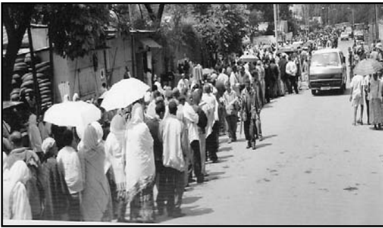
Fakkii 10.2 Filannoo dimookiraatawaa