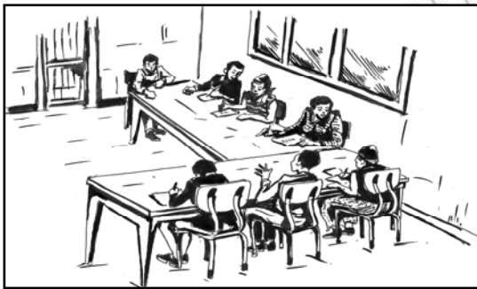
Fakkii 10.3 Wal gahii koree misoomaa