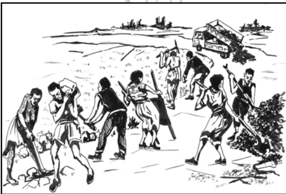
Fakkii. 10.1 Naannoo keenya waliin haa misoomsinu.