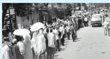
Jaantuska 10.3. Doorasho dimuqraadi ah.