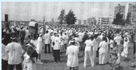
Sawir 10.4. sanad guuraha ururada bisha cas iyo dayaxa casharci