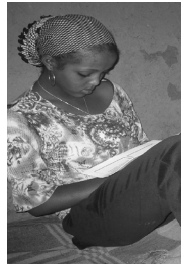
Fakkii 11.8 odeeffannoon kitaaba irraa argama