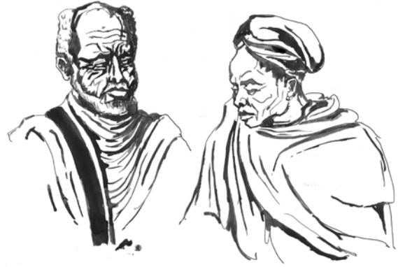
Fakkii 11.9 Fitawuraarii Mashashaa fi haadha warraa isaanii

“Baalaambaraas ebalu hintala kee naaf kenni jedhee jaarsa natti ergeem! Haa, haa. Haa, Ayi yeroo!”