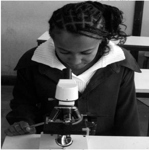
Fakkii.11.1 Qorannoo laaboraatoorii kessatti