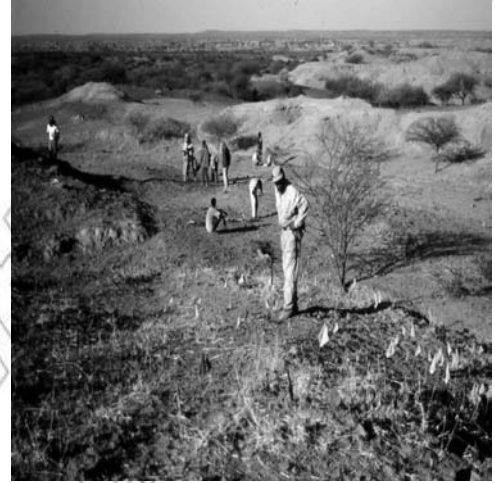
Fakkii.11.2 Qorqnnoo Arkiyoolojii