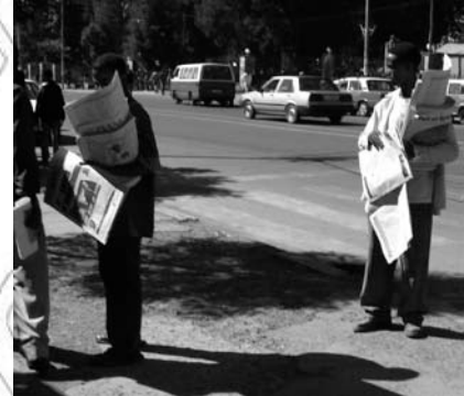
Fakkii 11.7 Odeeffannoon gaazixaa irraa argama