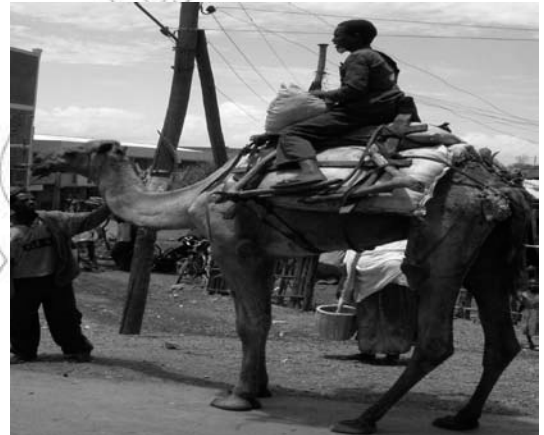
Fakkii 11.5 Gaala

Gaalli farada irra ni caala. Beelladoota kan biroo irras qaamaan dheeraadha. Yemmuu fe'amus ta'e yemmuu hiikamu ni jilbeefata. Dhaabbachuu yommuu barbaadus dursee miila lamaan boodaa ol kaasa. Namni yaabbatee yoo jiraates yeroo inni ka'u namtichi yaabbate jabeessee yoo qabachuu baate karaa mataa isaa darbatamee kufuu danda'a. Gaalli cimaa waan ta'eef meeshaalee ulfaatu baachuu danda'a.