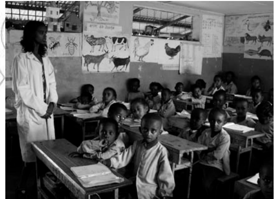
Fakkii 11.3 Barsiistuu kutaa keessatti