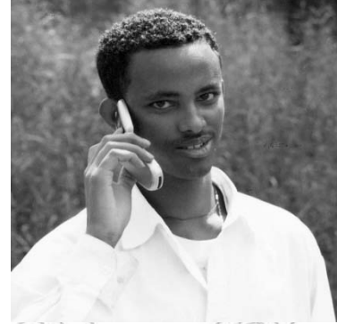
Fakkii 11.6 Odeeffannoon bilbilaan argama