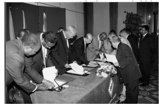
ሥዕል 1.3 ኢትዮጵያ የውጭ ግንኙነት ውል ስትፈራረም