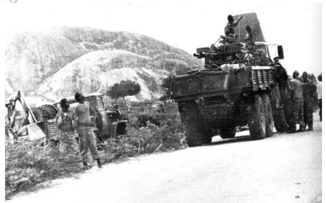
Fakkii 1.2: Raayyaa Nagaa Kabachiisaa Itoophiyaa