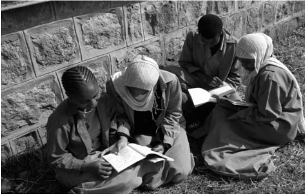
Fakkii 1.1 Baratooti Kiristaanotaa fi Musilimooti waliin yoommuu qayyabatan