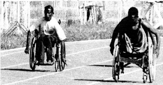
Fakkii 3.3: Qaama Miidhamtoota Ogummaa Adda Addaa Irratti Bobba'an