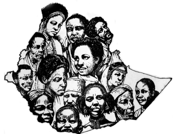
Fakkii 3.1. Saboota, Sablammoottaa fi Ummattoota Itoophiyaa