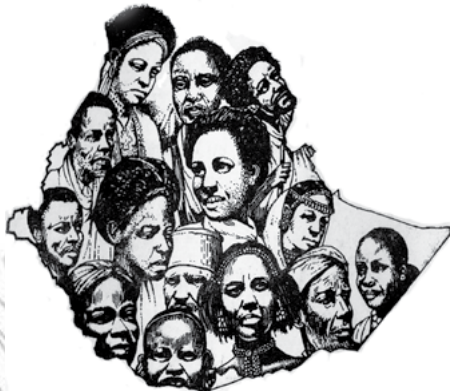
ስእሊ 3.1. ስእሊ ብሄራት ፣ ብሄረሰባትን ህዝብታትን ኢትዮጵያ