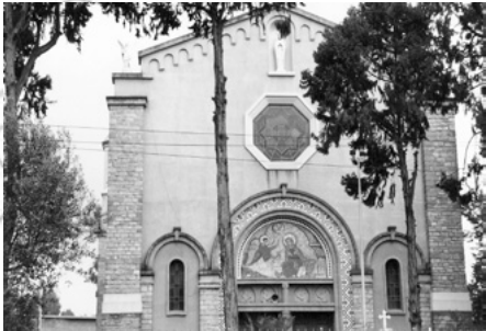
3.4 ኣብ ሕገ መንግስቲ ፌዴራላዊ ማዕርነት ሃይማኖት ተረጋጊፁ እዩ።