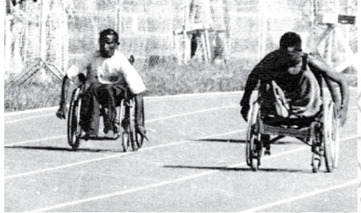
ስእሊ 3.3. አብ ዝተፈላለዩ ሙያታት ዝተዋፈሩ ጉዳዳት አካል