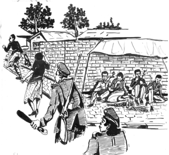
ምዕል 5.1 አፍራሽና ጉጂ ተገባራትን መቃወም ሀገሪን ከሚወድ ዜጋ ሆኖ ይጠበቃል