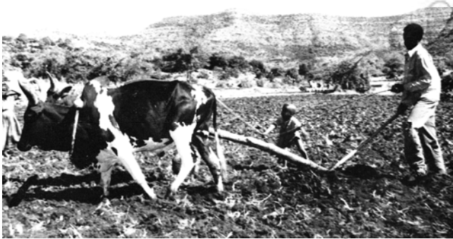
ምዕል 5.3 ጠንክር በመሥራት ድህነት ይወገዳል