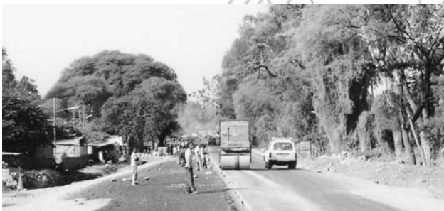
ምዕል 5.4 ስህገር አደገት ሁሉም የበኩሉን ስለተዋጸኑ ማደረግ አለበት