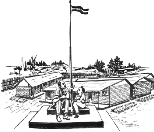
ምዕል 5.5 ብሔራዊ ሰንደቅ ዓላማ የሱዳንግታቸን መገለጫ ነው